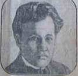
Vladimir de Trotski

Le manifeste propose un armistice entre l'Allemagne et la Russie. Le manifeste vise au démantèlement de la Russie et veut consolider par un armistice la situation militaire présente.