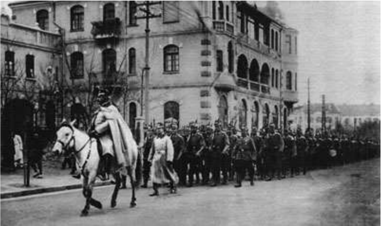
Contingent allemand à Tsing-Tao