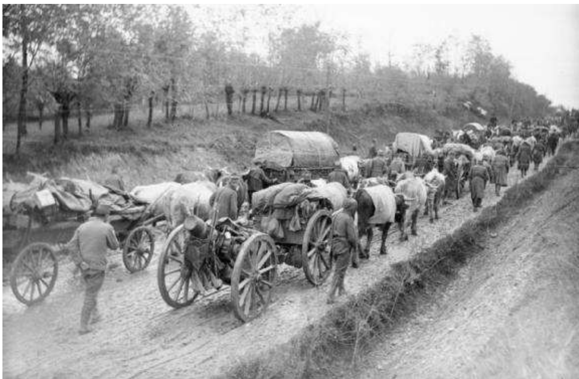
Retraite de l'armée serbe face aux austro-hongrois

8 : nouvelle invasion austro-hongroise : retraite serbe