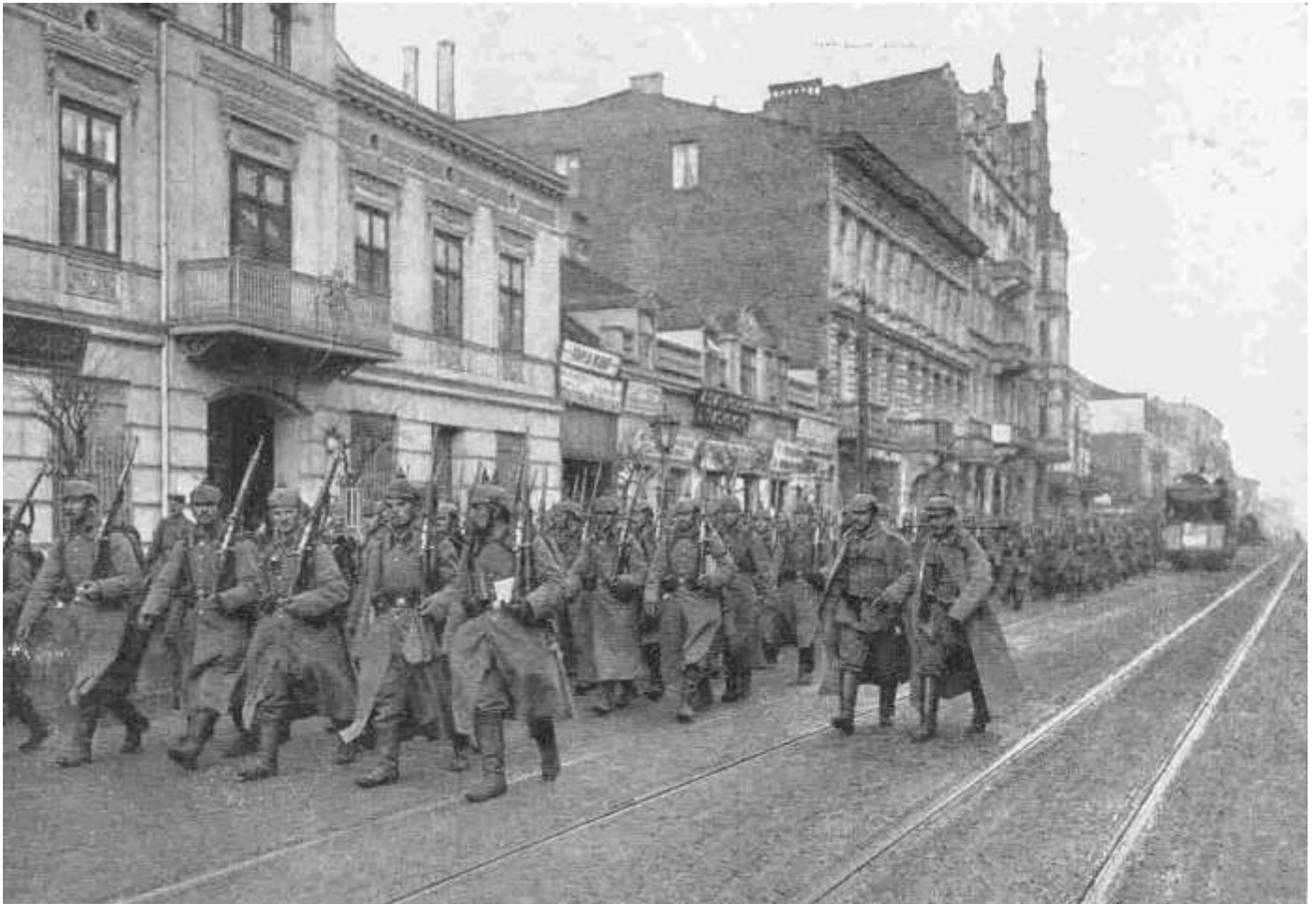
Les allemands entrent dans Lodz (DR)