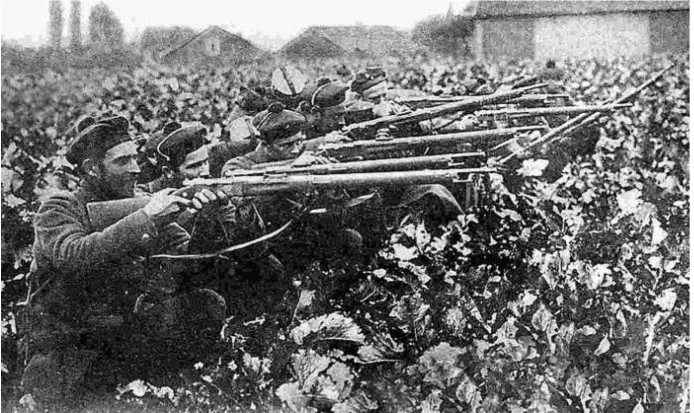
Fusiliers marins français durant la bataille d'Ypres