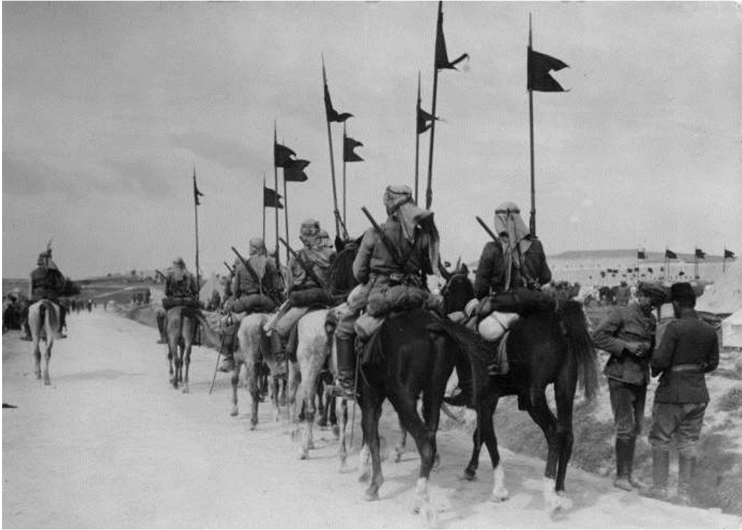
Cavalerie de l'empire ottoman