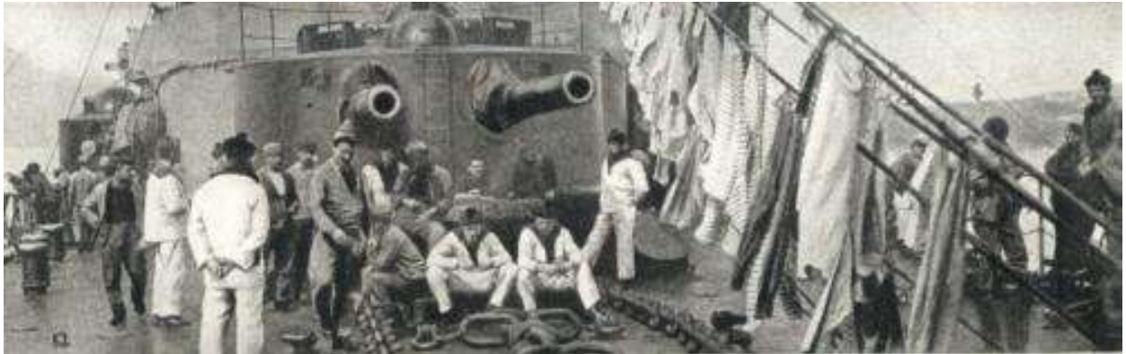
Mutins français lors de la révolte de la flotte en mer noire (Matière et Révolution)