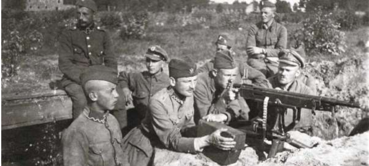
Position polonaise contre les soviétiques