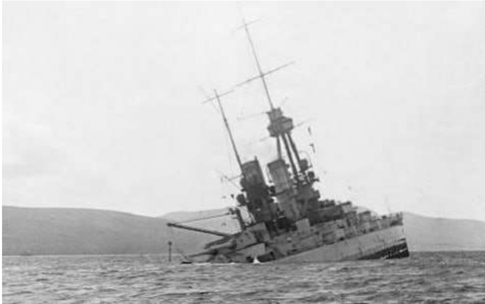
Un des navires allemands sabordés à Scapa Flow

21 : sabordage de la flotte allemande internée à Scapa Flow (Al von Reuter)