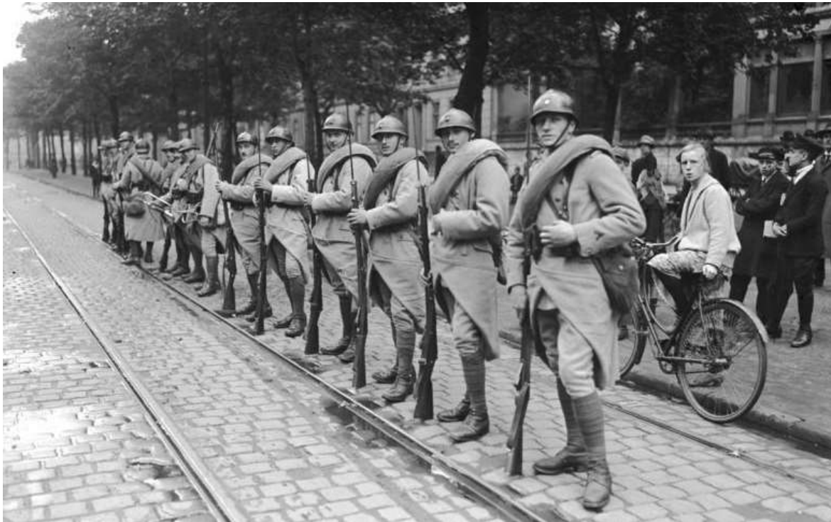
Les français occupent la Rhénanie

Entrée des Américains à Coblenz et des Britanniques à Cologne 13 : la convention d'armistice est renouvelée pour un mois 14-30 : après la démission de l'hetman Skoropadski, les troupes bolchéviques et leurs alliés ukrainiens dirigés par Petlioura occupent l'Ukraine 17 : fin de l'évacuation de la Finlande par les Allemands Débarquement à Odessa des troupes franco-grecques 18 : la 156 e D.I est déployée en Crimée en soutien des « Blancs » 29 : débarquement britannique à Riga