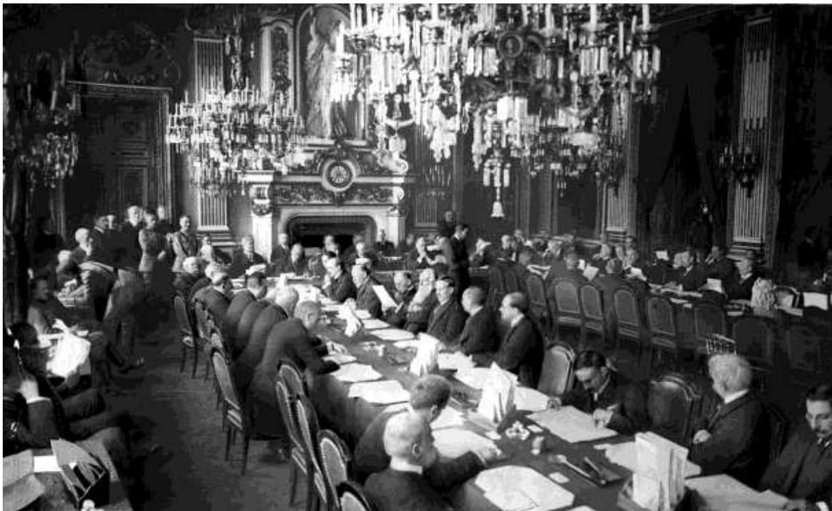
Ouverture de conférence de paix (DR)