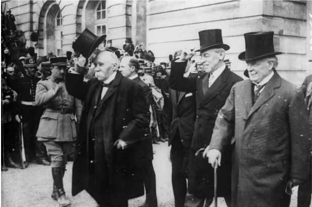
Le président Wilson et Georges Clémenceau

25 : création d'une zone neutre entre Hongrie et Roumanie, en Transylvanie