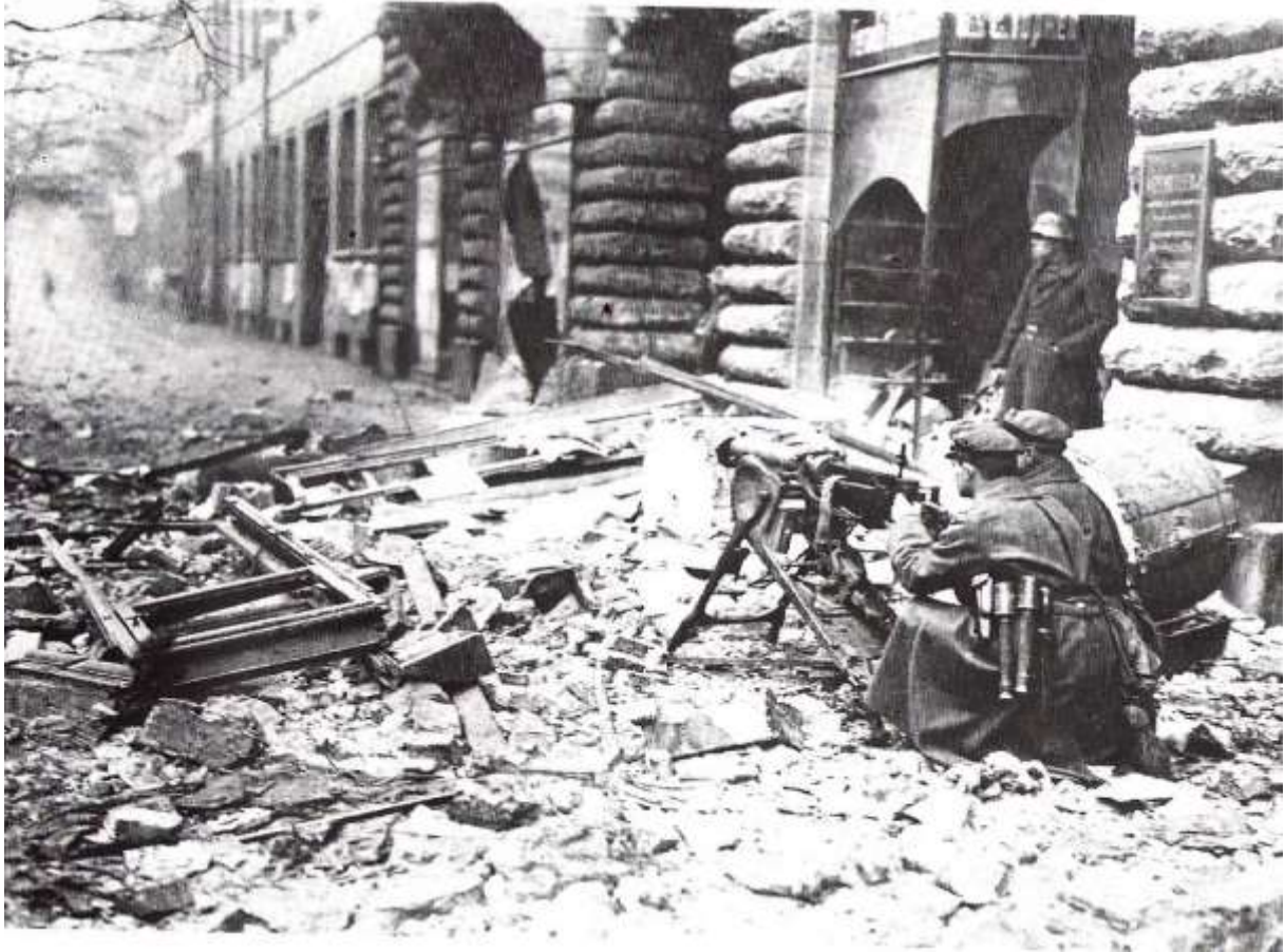
Combat dans une rue de Berlin