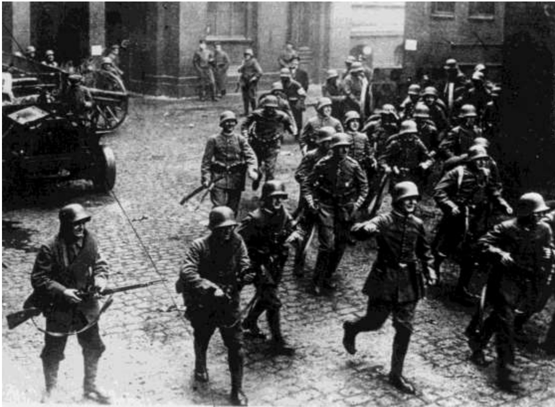
Combat dans Berlin lors du soulèvement spartakiste

28 : Grande-Bretagne : nouveau gouvernement Llyod George