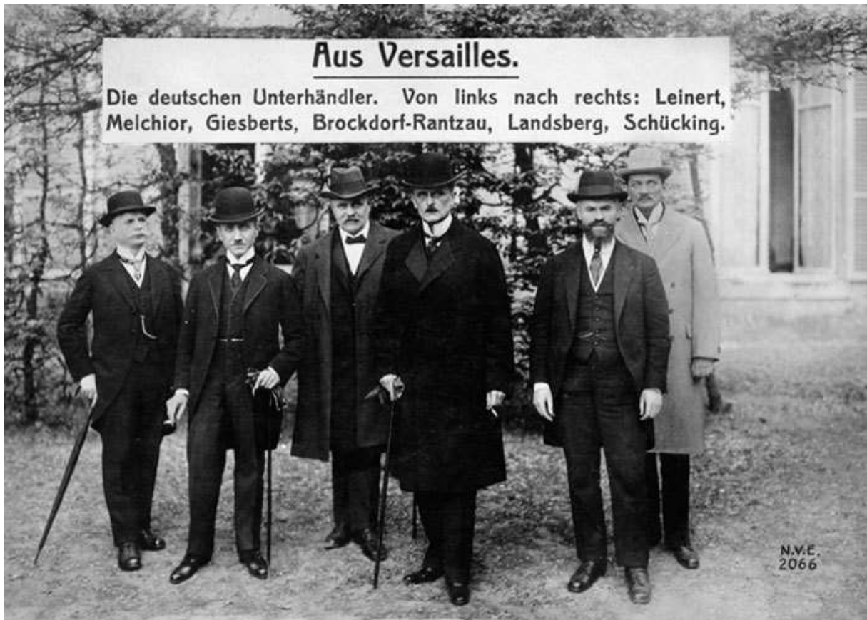
Délégation allemande à la conférence de la paix

29 : 7 e séance plénière de la Conférence de la Paix : les Allemandes remettent leurs contre-propositions