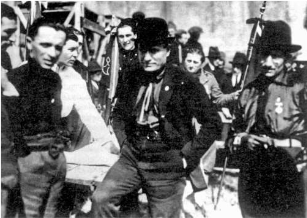
Mussolini en 1919 (DR)

23 : Création à Milan par Mussolini des Faisceaux italiens de combat , futur Parti national Fasciste