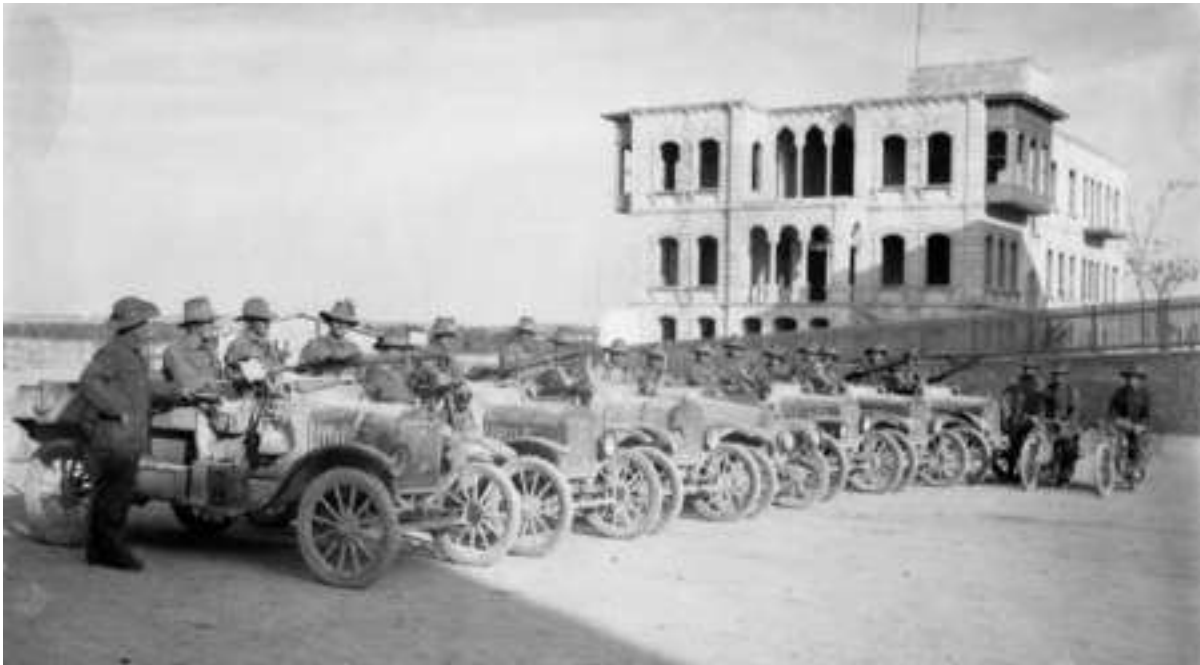
Troupe australienne à Alep