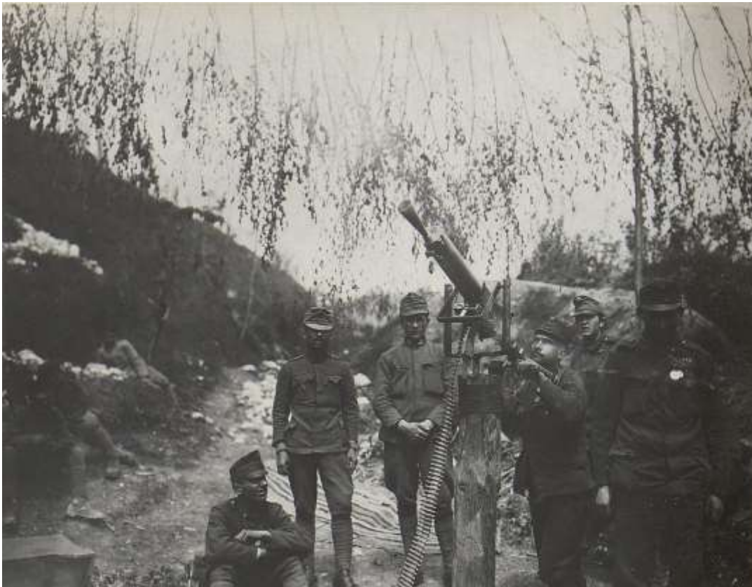
Mitrailleuse anti-aérienne austro-hongroise sur le Piave