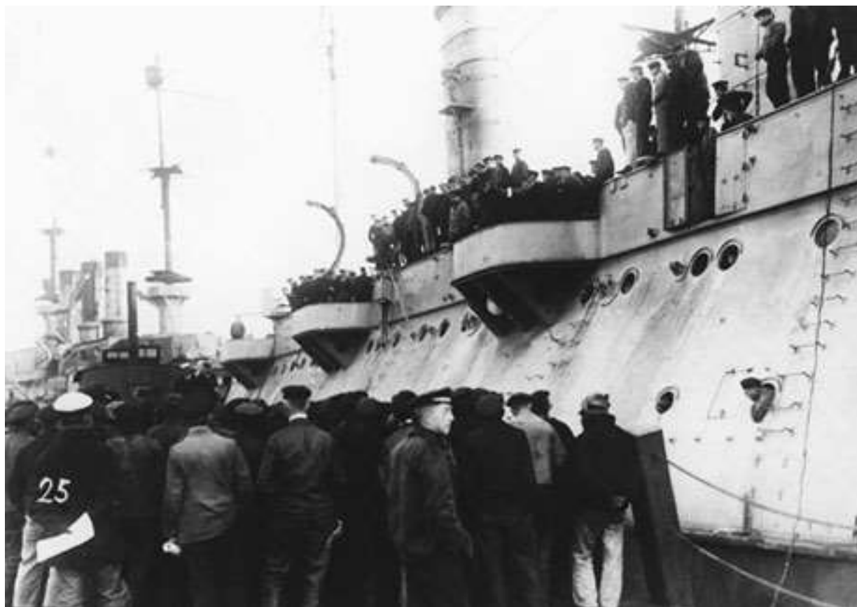
Des matelots allemands se mutinent dans le port de Kiel

29 : mutineries de la flotte austro-hongroise à Pola (aujourd'hui Pula en Croatie)