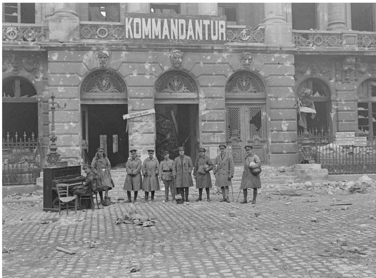
Cambrai vient d'être libéré par les troupes britanniques