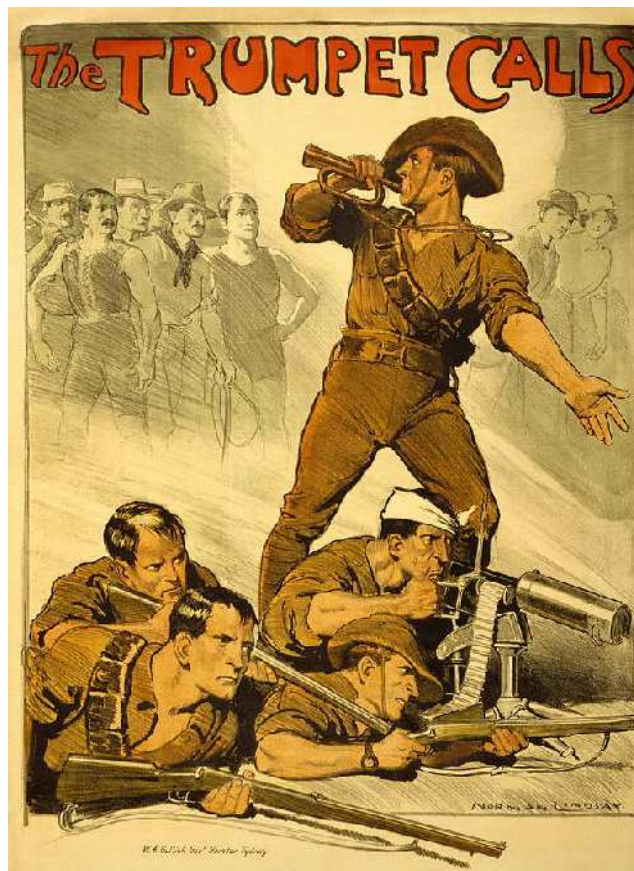
Affiche de recrutement de l'armée australienne – 1914 (bibliothèque du congrès)

2 : débarquement japonais à Tsing-Tao (baie de Lao-shan)