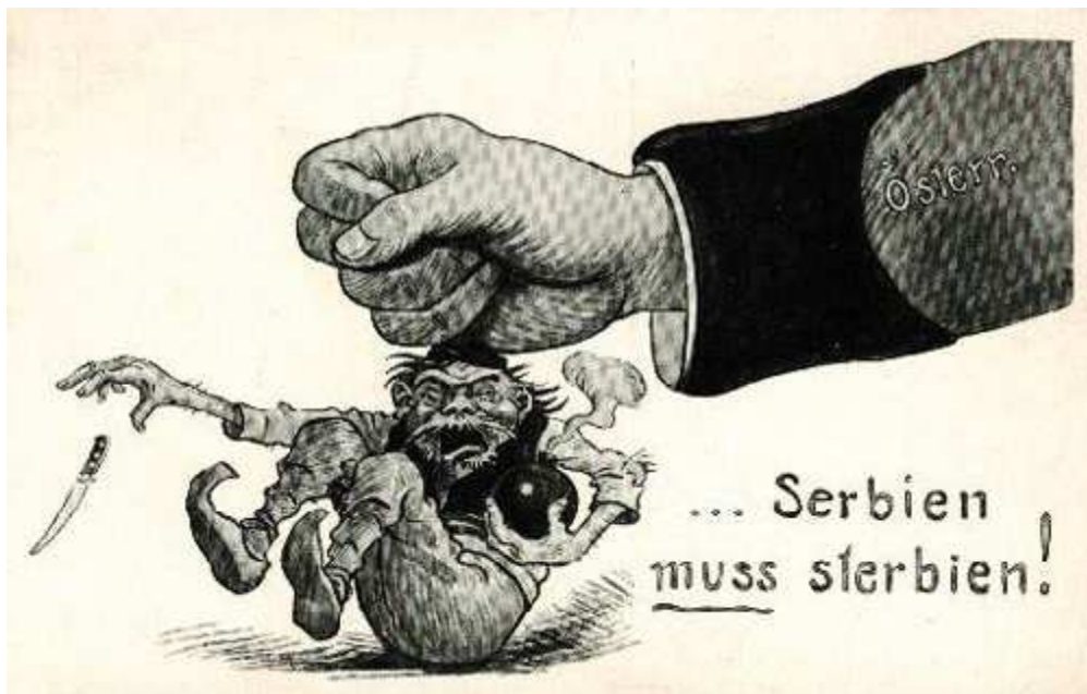
Carte satyrique autrichienne « la Serbie doit mourir »

5 : entrée des Serbes en Sirmie (ancienne province austro-hongroise répartie aujourd'hui entre la Croatie et le Serbie)