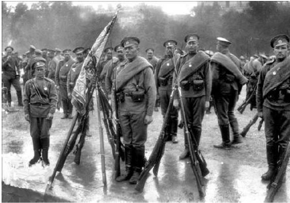
La garde au drapeau d'un régiment russe en 1914

2 : Pologne : l'offensive austro-hongroise est enrayée