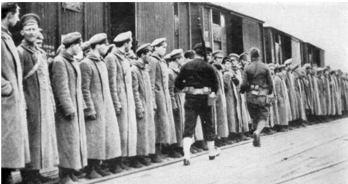
Des prisonniers de l'armée rouge sont embarqués par des soldats américains à Arkhangelsk

30 : la Dvina Force doit se replier sur le confluent de la Vaga. En revanche, la Vologda Force progresse légèrement malgré une forte résistance : la rivière Kyama est franchie et l'avance vers Obozerskaya, reprise.