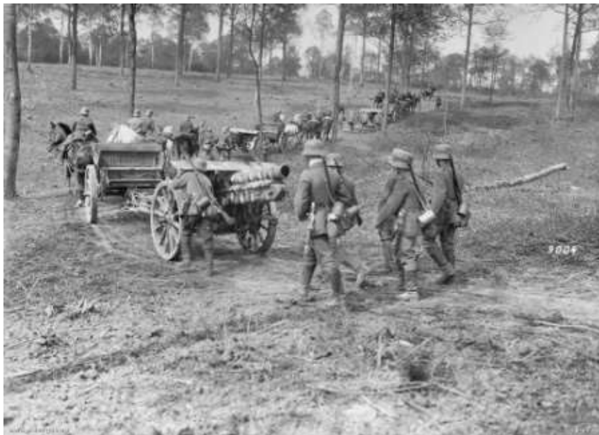
Une batterie d'artillerie allemande se déplace aux abords du Mont Kemmel