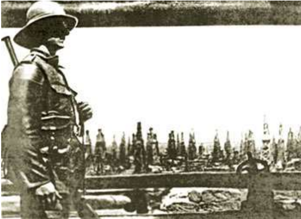
Un soldat britannique de la Dunster force à Bakou