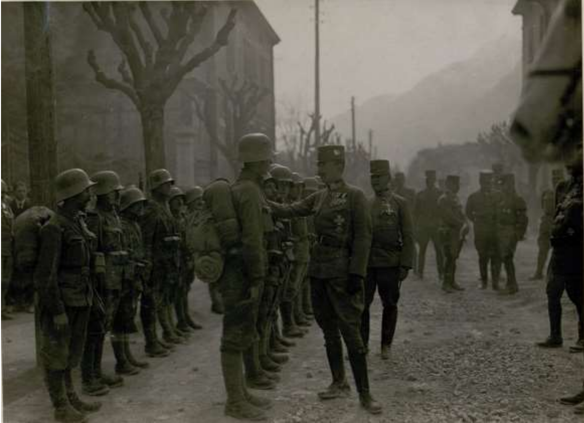
Soldats austro-hongrois inspectés par l'empereur Charles

8 : offensive franco-anglo-italienne sur le front du Tyrol