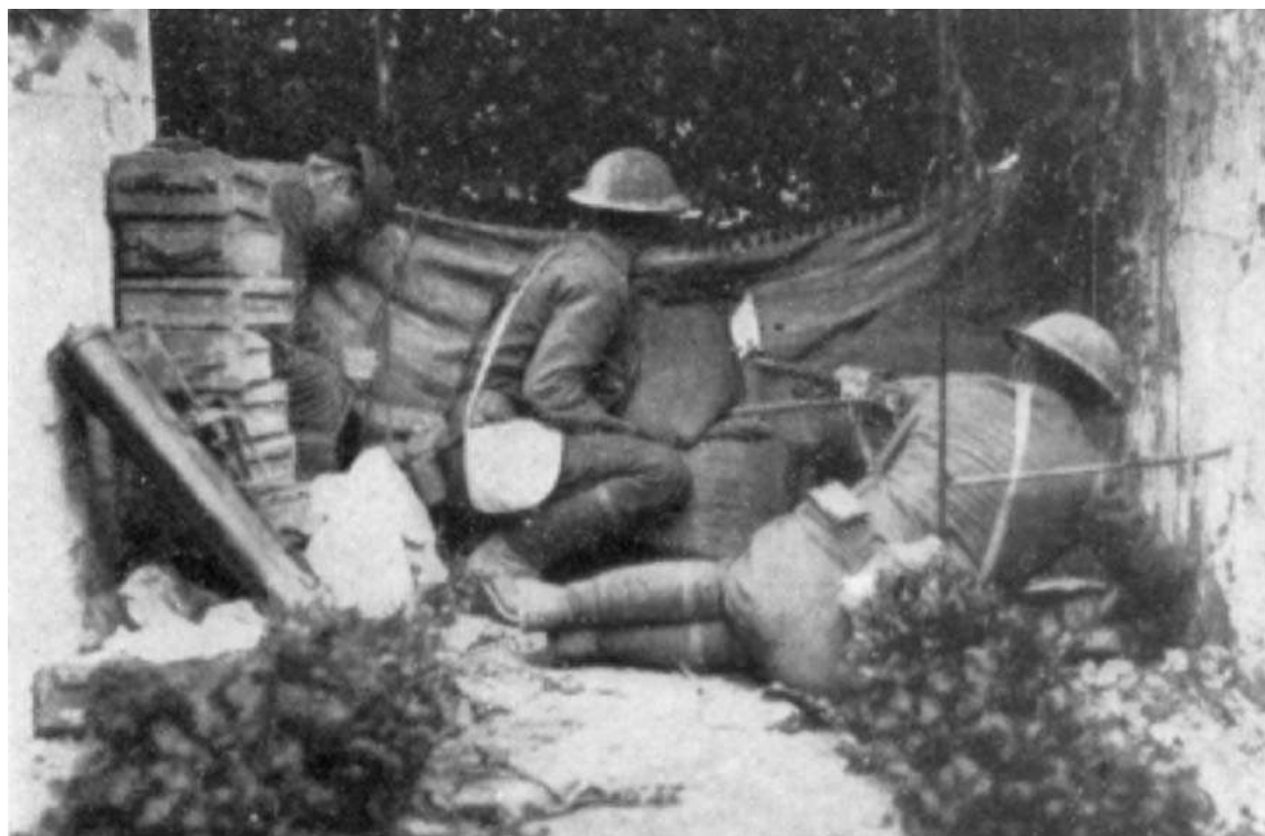
Mitrailleurs américains lors des combats dans Château-Thierry