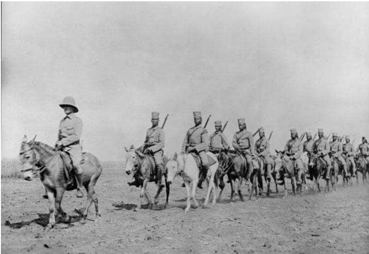
Quelques sur le front africain...

2/7-2/11 : combats dans la région de Namacurra (Mozambique) entre Anglo-portugais et Allemands