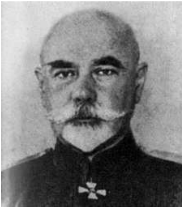
Le Général Anton Denikine