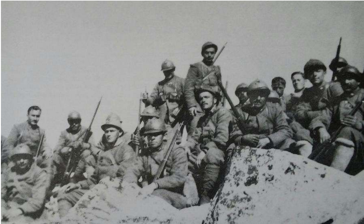
Infanterie italienne

24 : offensive austro-hongroise en Albanie