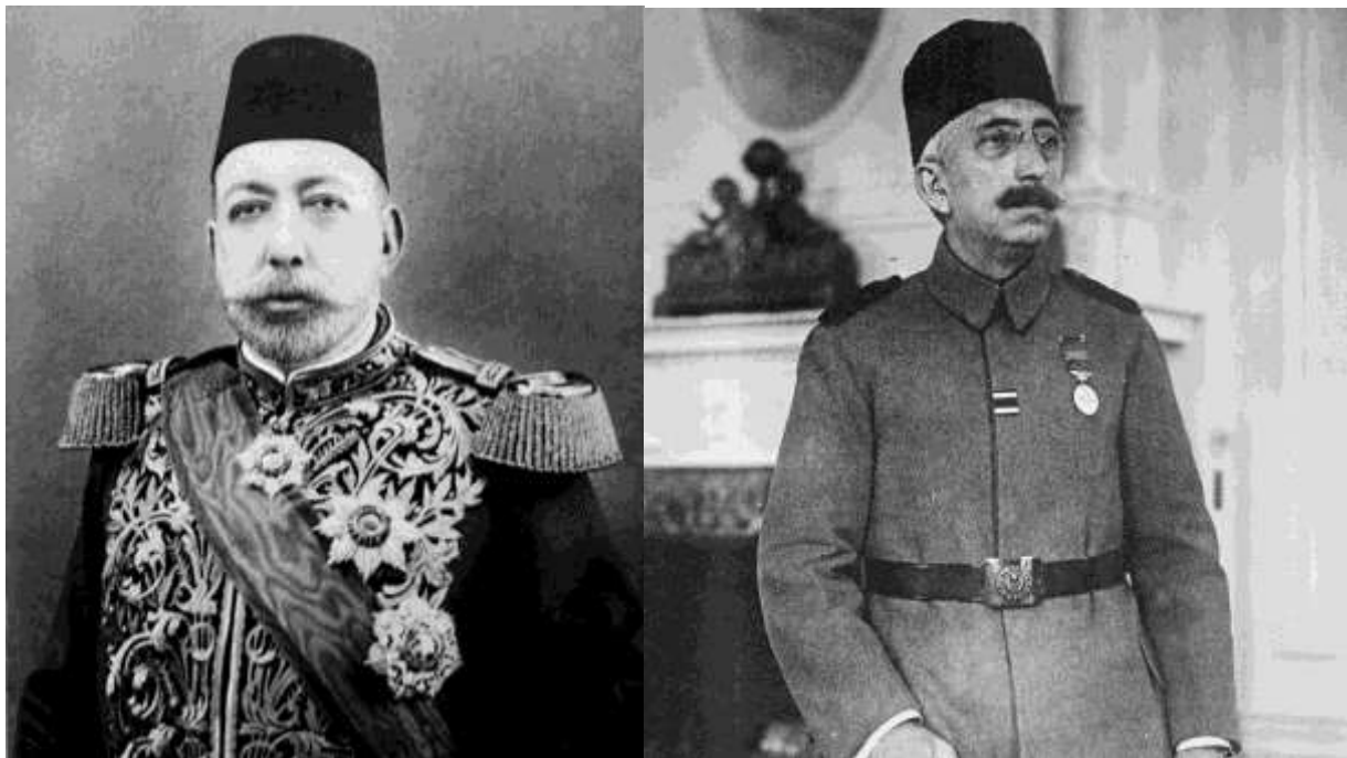
Mehmet V et Mehmet VI