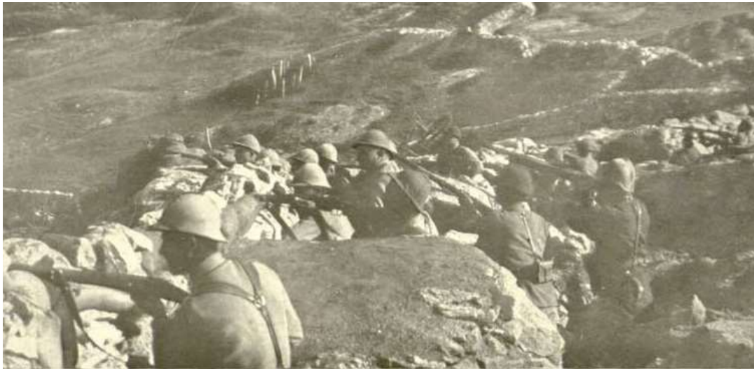
Soldats serbes en position sur le massif de Dobropolje

30 : les Grecs enlèvent le massif du Skra di Legen (Grèce)