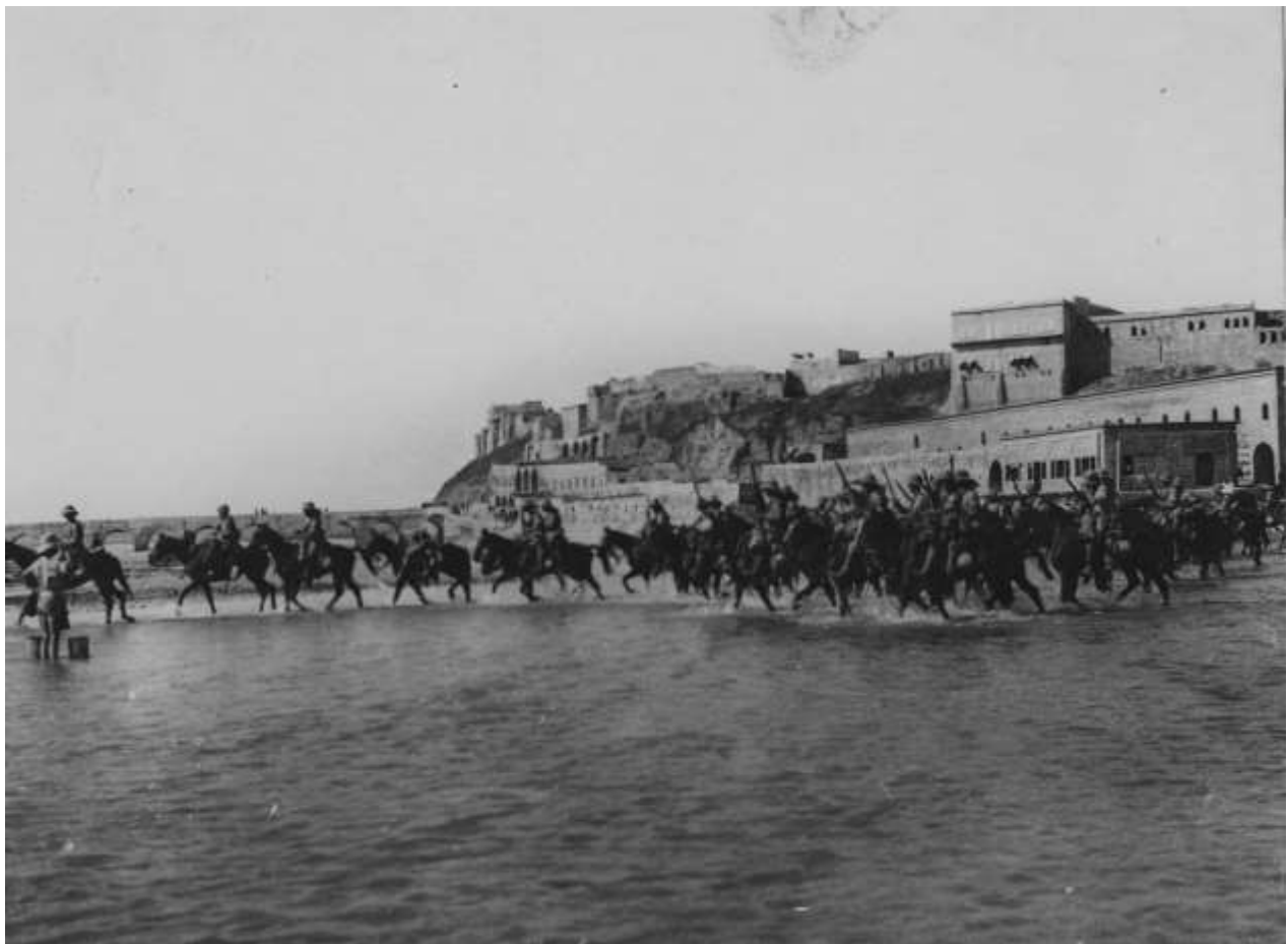
Les britanniques occupent Kirkuk (DR)

22-26 : défaite turque contre les Arméniens devant Erevan (Arménie)