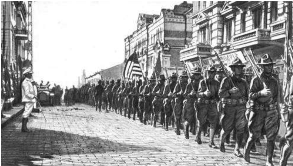
Les troupes américaines débarquent à Mourmansk