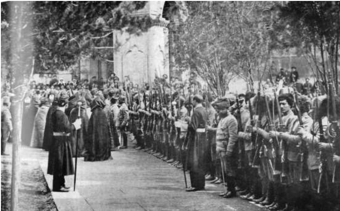
Une prise d'armes en Arménie