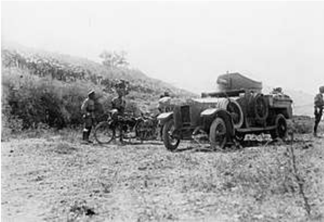
Automitrailleuse britannique en Irak