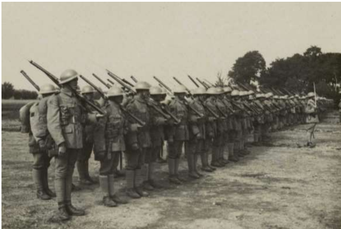
Soldats portugais lors d'une revue des troupes