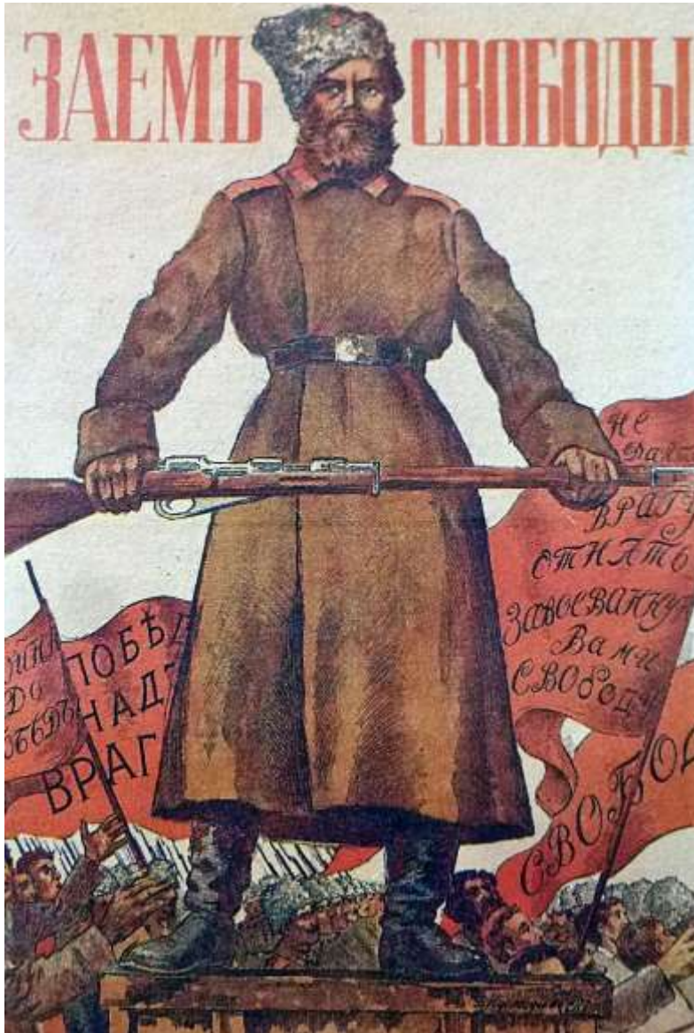
Lénine demande la protection du Reich allemand – propagande bolchévique

23 : le Guatemala déclare la guerre à l'Allemagne Rétablissement des relations diplomatiques Allemagne – Russie