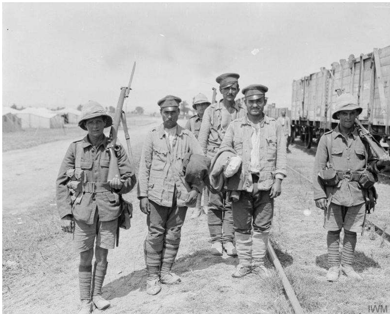
Prisonniers bulgares aux mains des britanniques

16 : offensive alliée le long de la Struma