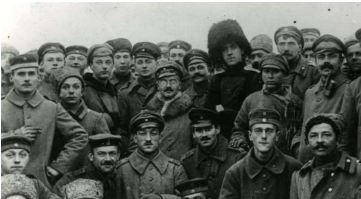
Fraternisation entre soldats allemands et russes

Suite à l'armistice signé le 15 à Brest-Litovsk, aucun combat n'a lieu sur ce front, sauf quelques engagements russo-bolchéviques préluant à la guerre civile.