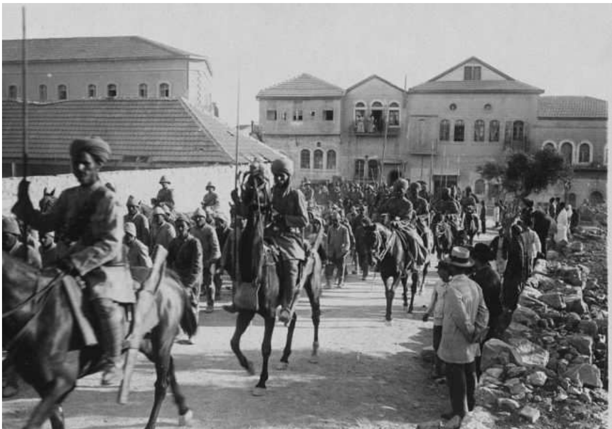
Prise de Jérusalem par les britanniques -lanciers du Bengale

27 : échec d'une contre-attaque de l'armée germano-turque Yildirim sur Jérusalem