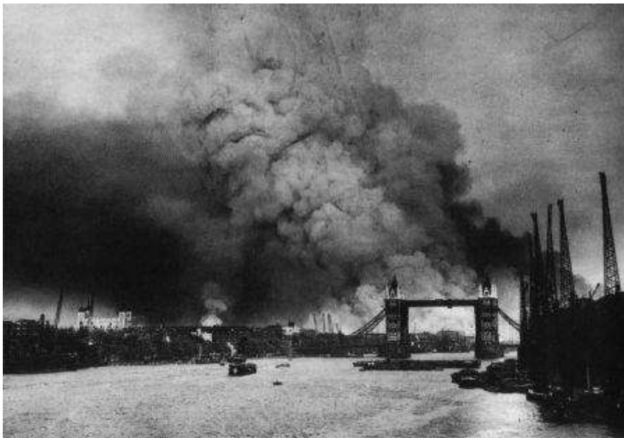
Bombardement sur Londres

31 : l'U.S. Navy et la Royal Navy font leur jonction à Scapa Flow (Grande Bretagne)