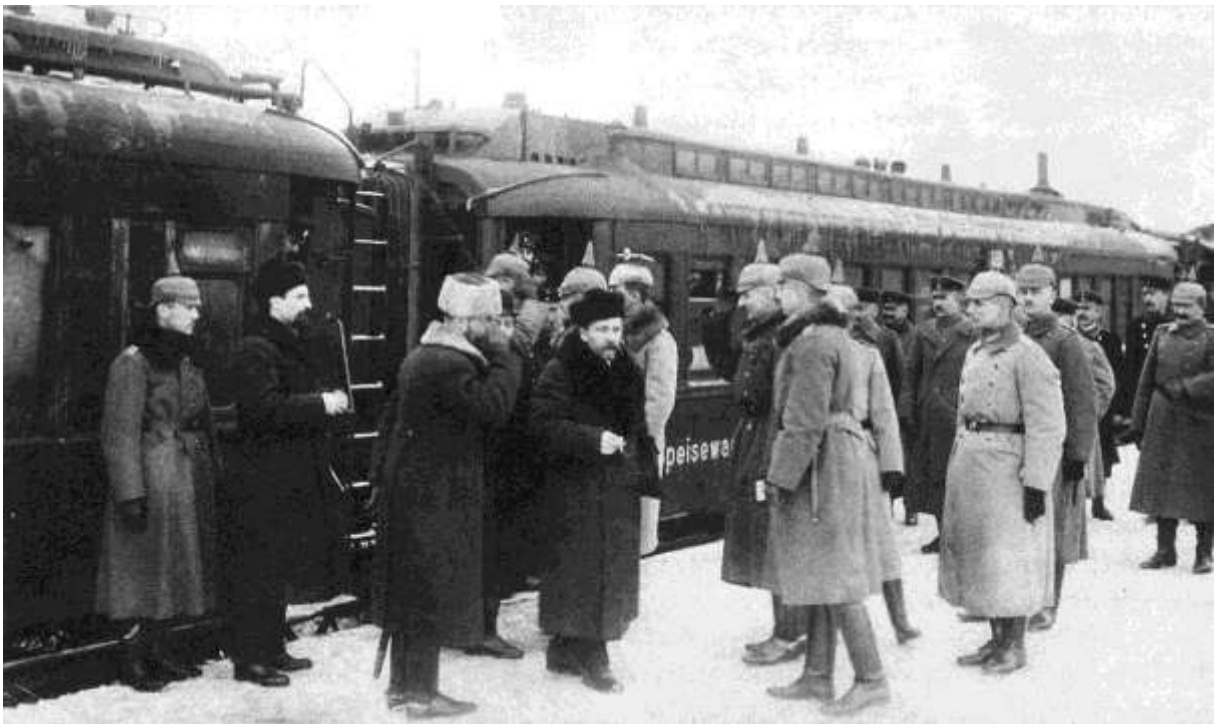
Arrivée de plénipotentiaires russes à Brest-Litovsk (DR)