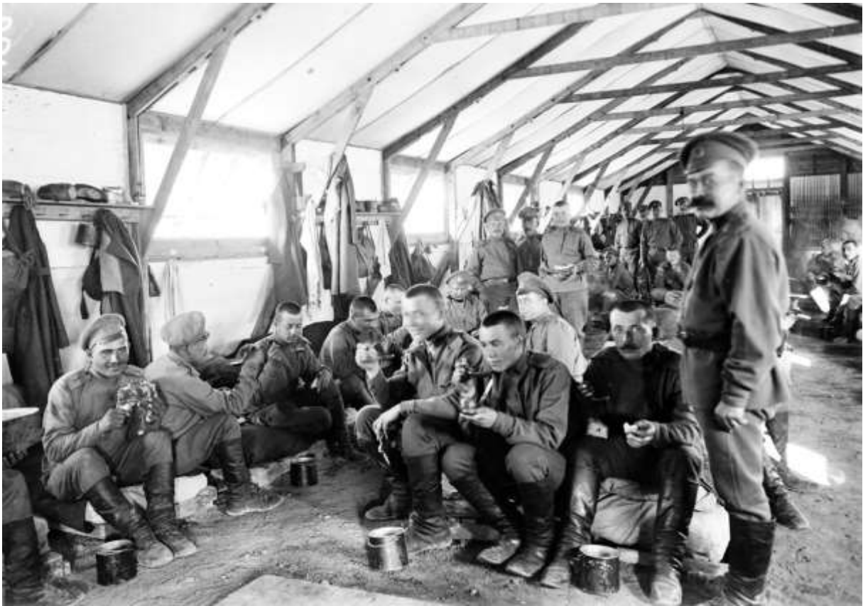
Soldats russes en attente de transfert