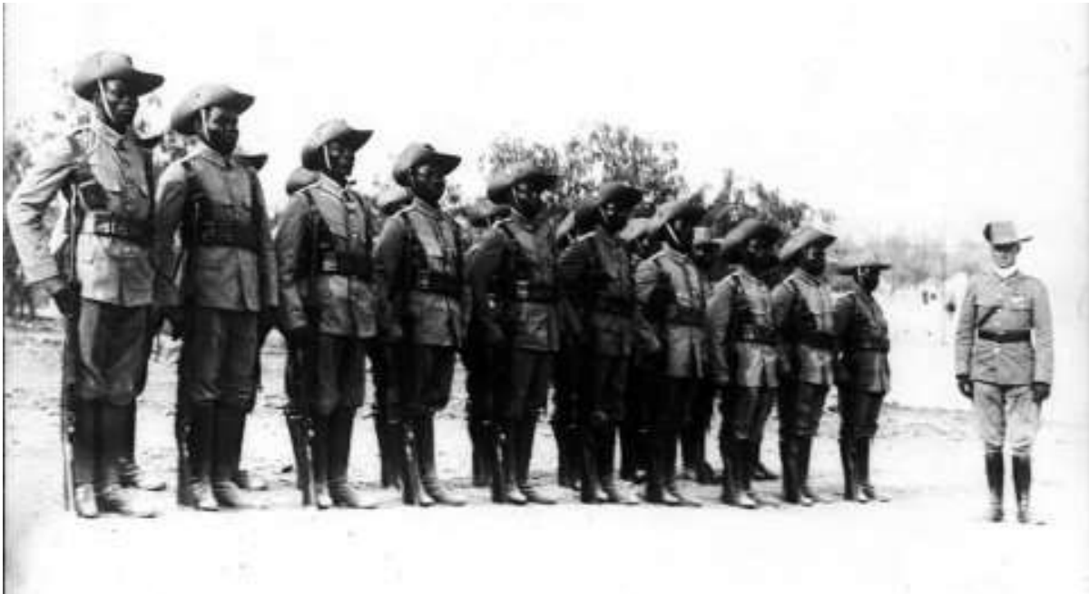
Un peloton de la Deutsche Ostafrika (DR)