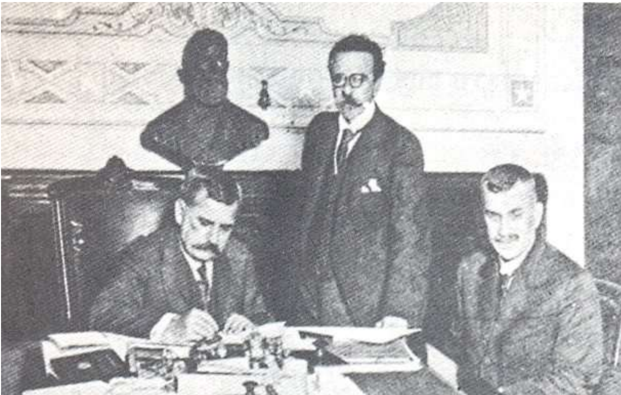
Le président brésilien Venceslau Bras signe l'acte de déclaration de guerre contre l'Allemagne