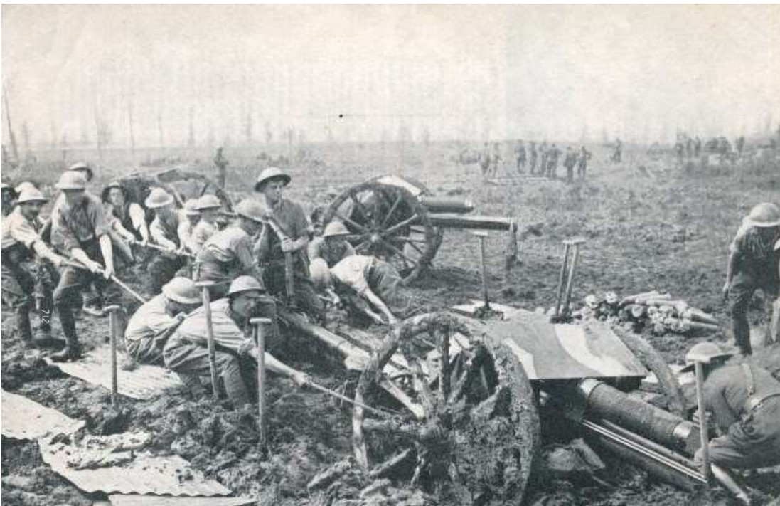
Pièce d'artillerie britannique embourbée durant la bataille de Passchendale