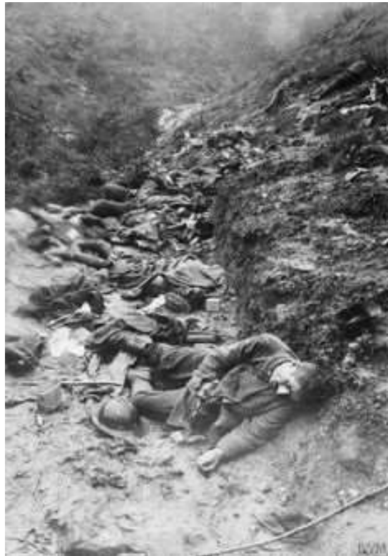
Soldats italiens tués lors de la bataille de Caporetto