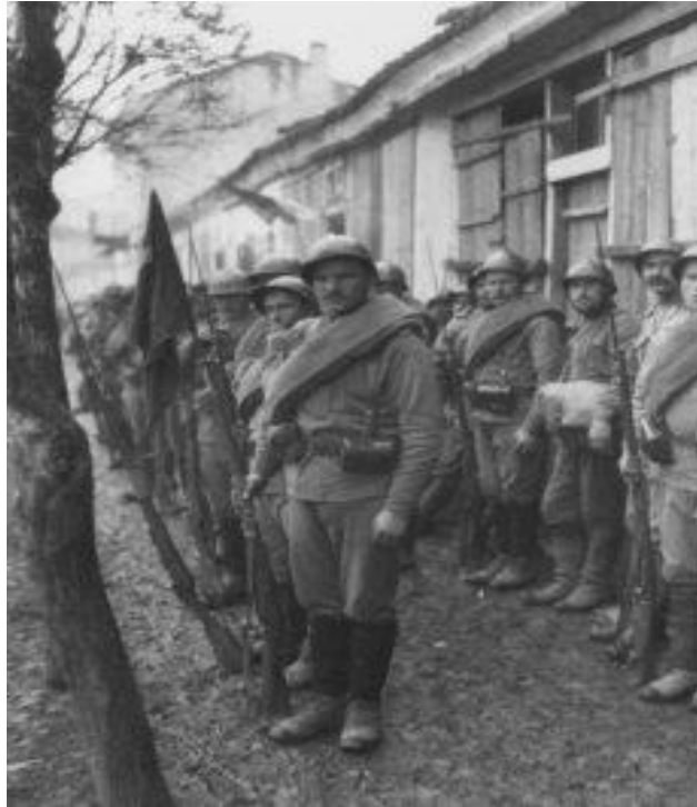
Soldats bulgares