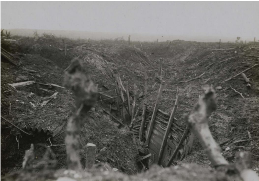
Une tranchée allemande conquise à Gommecourt

Calais) 28 : les Britanniques occupent Thillooy (Pas-de-Calais), Puisieux (Pas-de-Calais) et Sailly-Sallisel