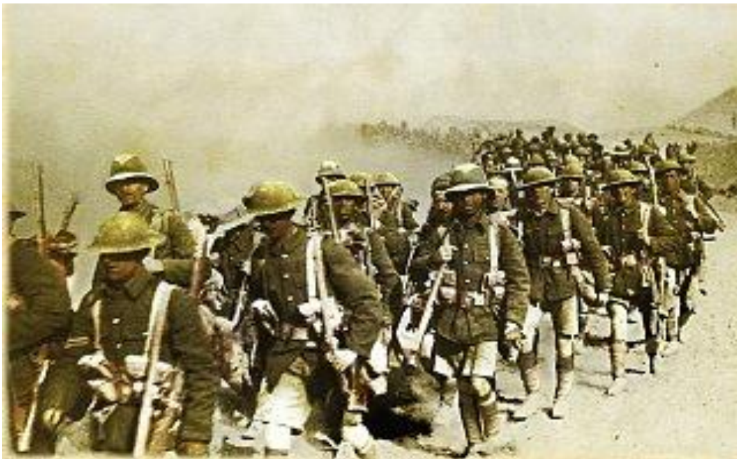
Soldats britanniques en Mésopotamie