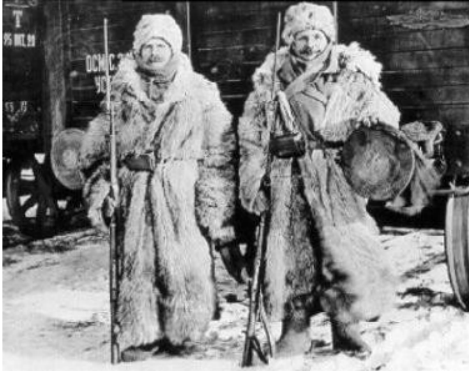
Soldats russes durant l'hiver 1916 (DR)

4 : offensive générale allemande sur le front sud des Russes 15-16 : les Russes perdent Tarnopol (aujourd'hui Ternopil en Ukraine)