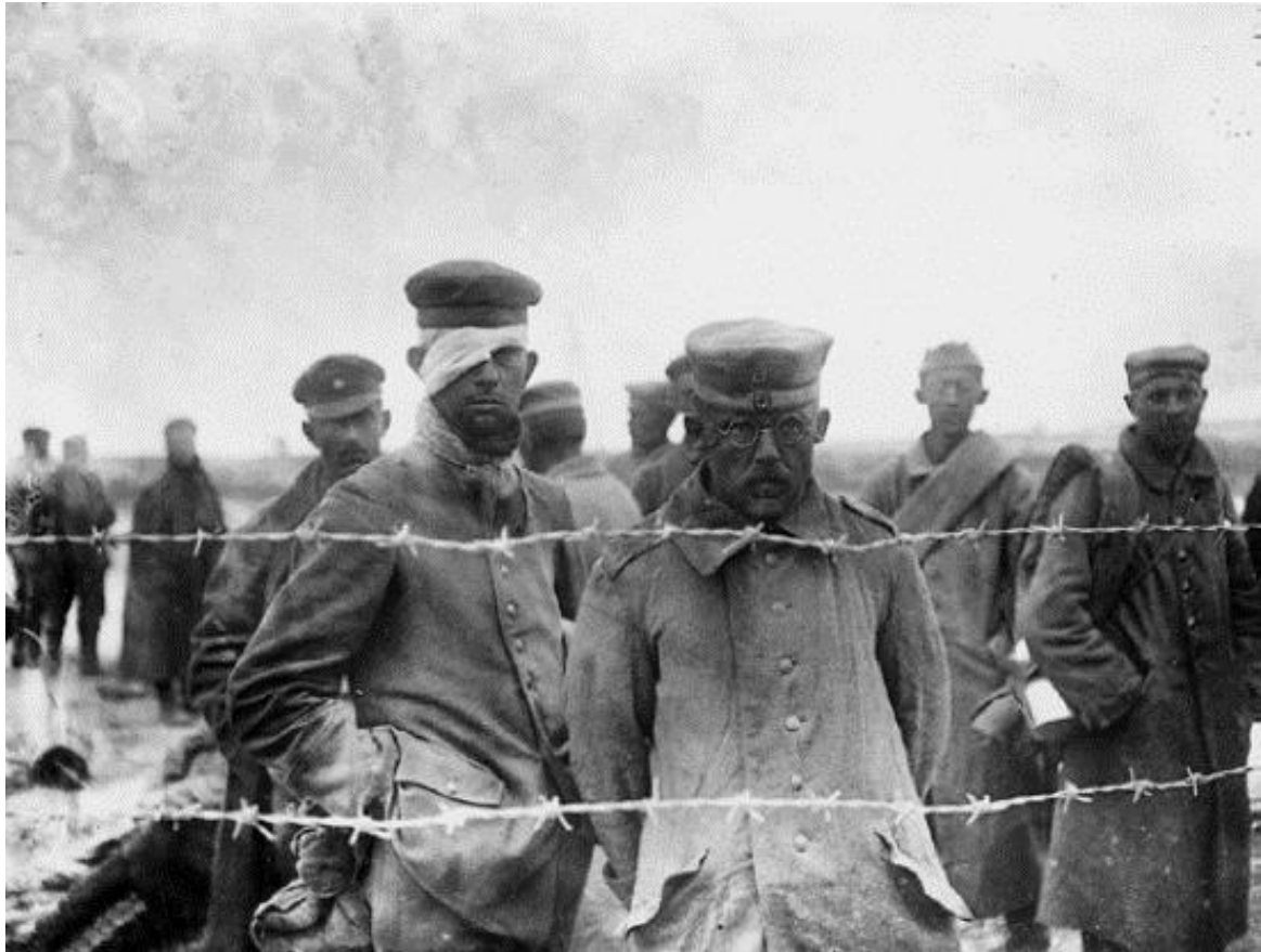
Les propositions de paix de l'Allemagne sont rejetées. Ces prisonniers allemands ne rentreront pas chez eux de sitôt.