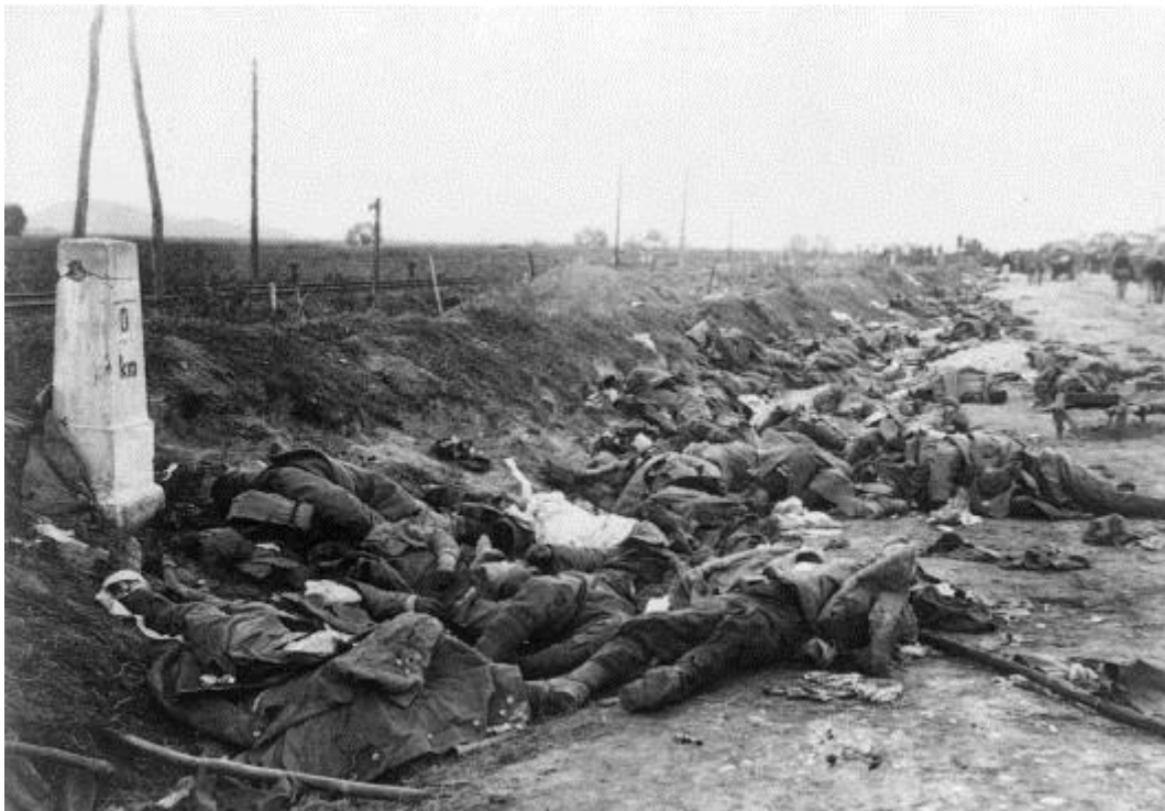
Soldats roumains tués au combat