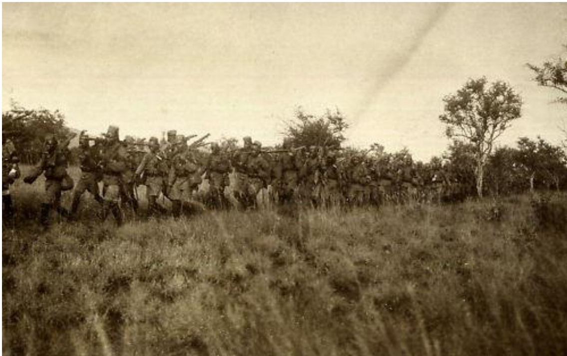
Troupe indigène britannique progressant sur le front de Tanzanie