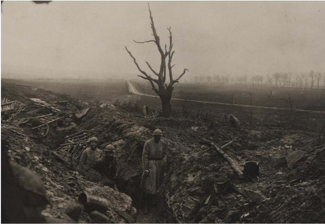
Le ravin du Monument à Vacherauville, le 22 décembre 1916

15-18 : offensive française entre Meuse et Woëvre : prise de Vacherauville et de la côte du Poivre, du bois des Caures, de Bezonvaux et de la ferme des Chambrettes 1 . Fin de la bataille de Verdun