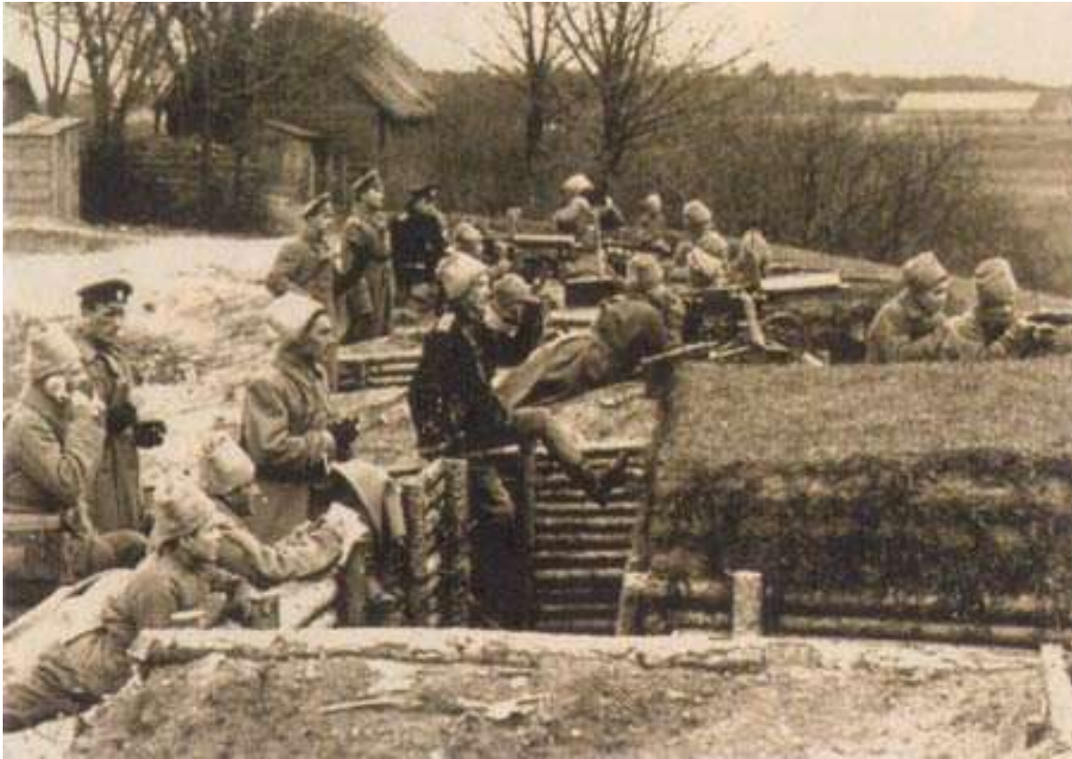
Position de mitrailleuses russes - secteur de la Dvina (Narod. Gosudarstvo. Vremia)

30 : offensive allemande en Galicie : repli russe sur Mieczyscov