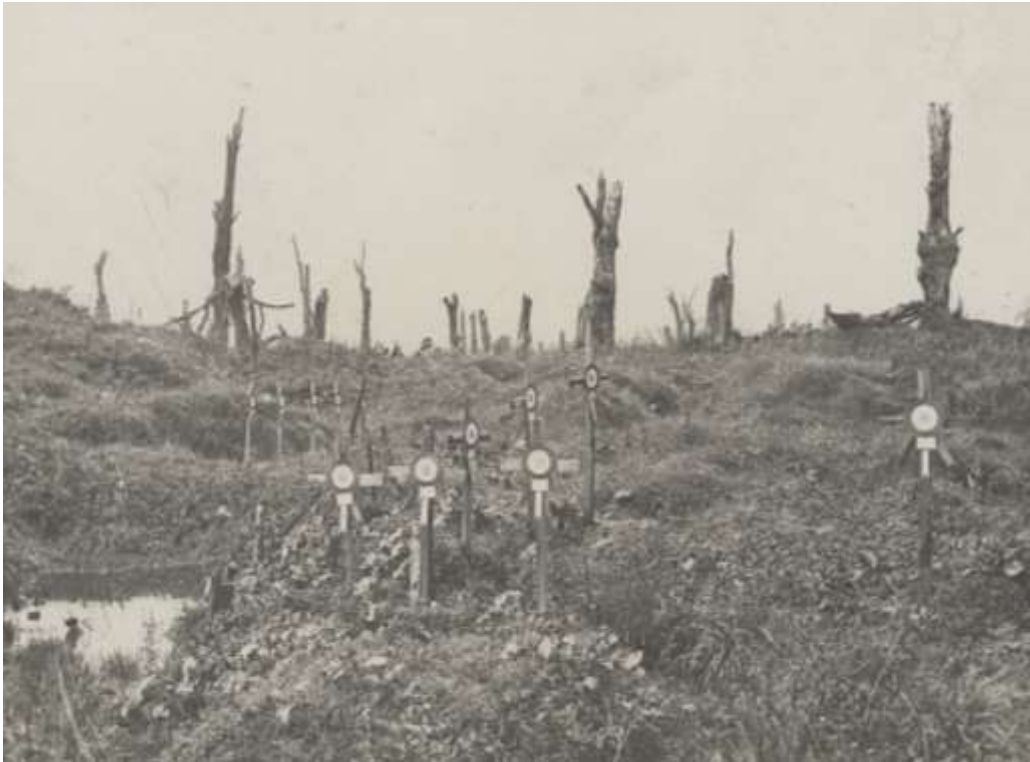
Emplacement du château de Saily-Saillisel