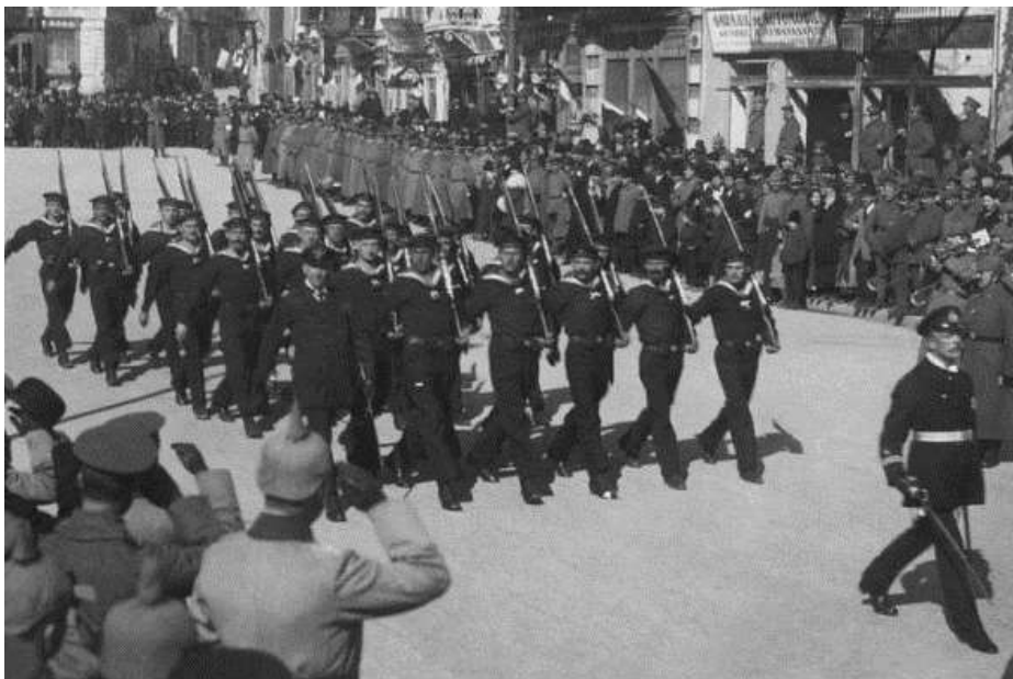
Marins allemands défilant dans Constanza