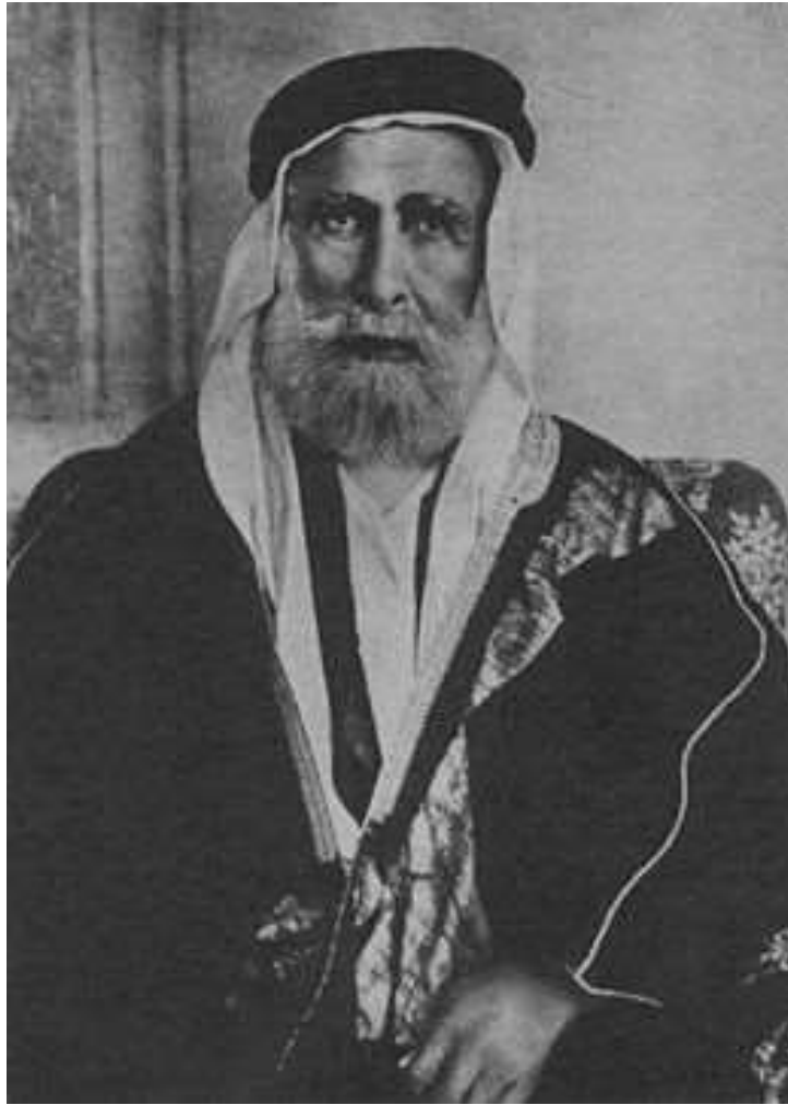
Hussein ben Ali, roi du Hedjaz

29 : le Chérif de la Mecque (aujourd'hui Makka en Arabie Saoudite), Hussein ben Ali, se proclame roi du Hedjaz (aujourd'hui Hijaz, région de l'Arabie Saoudite)