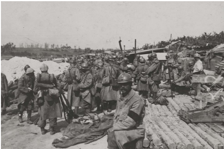
Poilus arrivant à Belloy-en-Santerre