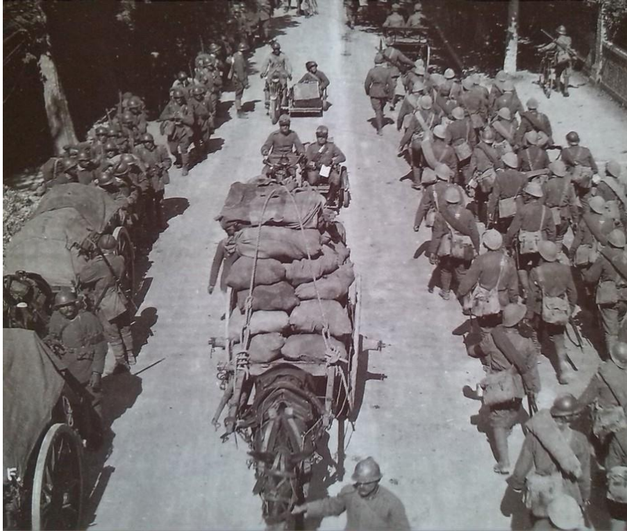
Infanterie italienne en mouvement

24 : bataille du Trentin : les Italiens occupent le monte Cimone (Italie)