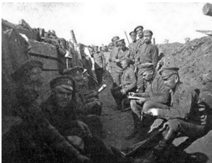
Infanterie russe sur le front de Riga