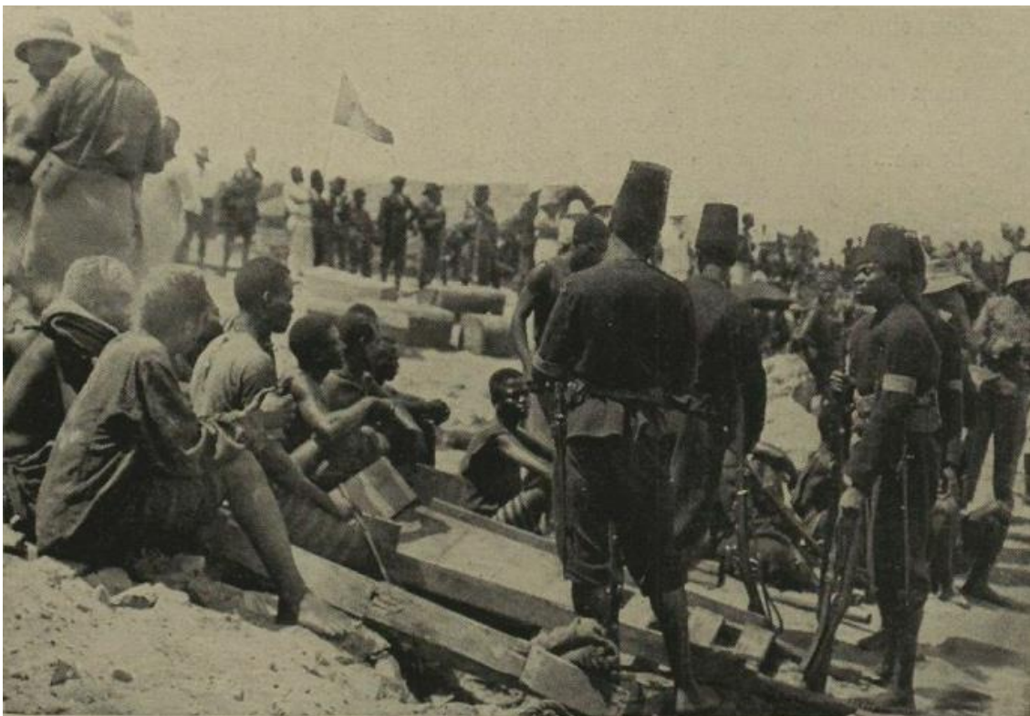
Supplétifs gardant des prisonniers sur le bord du lac Tanganika