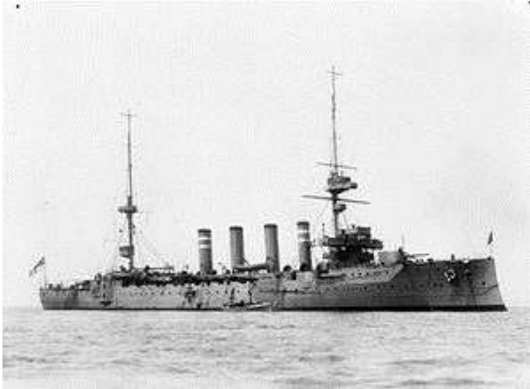
Le HMS Hampshire

22 : bombardement aérien de Karlsruhe (Allemagne)