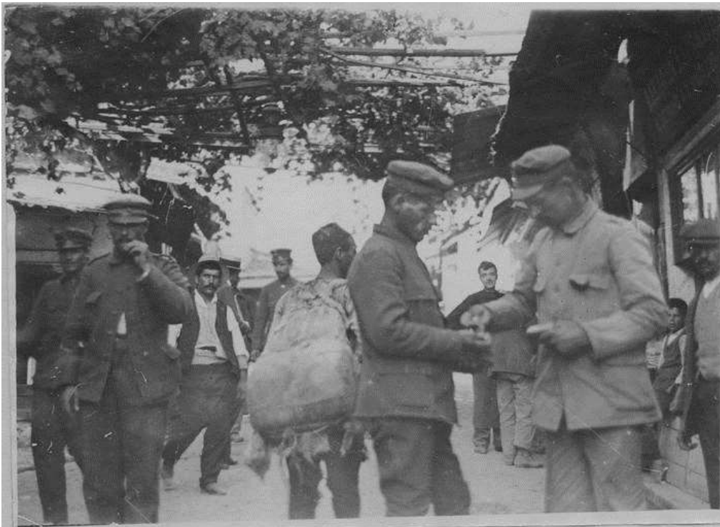
Soldats grecs démobilisés dans le secteur de Kavalla attendant le rembarquement.