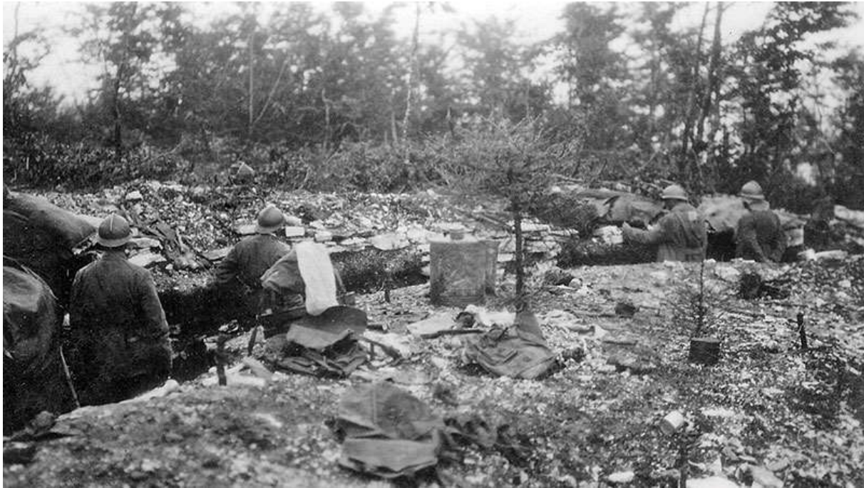
Positions italiennes sur le plateau d'Asiago