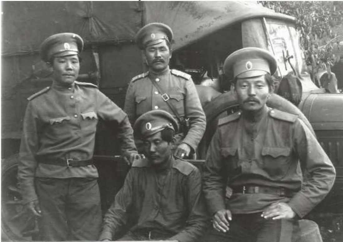
Cosaques du Don