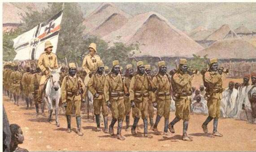
Troupe du Deutsche Ost Afrika (DR)

31 : Deutsche Ost Afrika : repli allemand de Mombo vers Handeni par la VF de Tanga (aujourd'hui en Tanzanie)