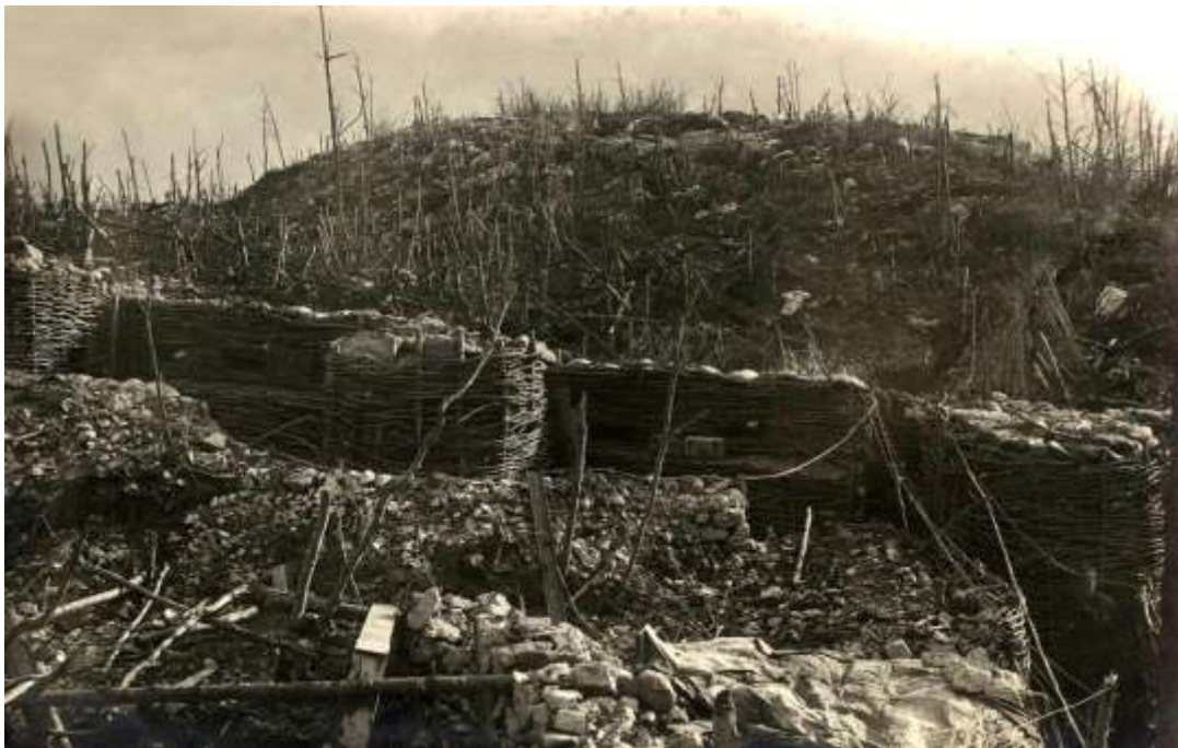
Le mont du Cimone (DR)

30 : bataille du Trentin : la 1 re A.It. arrête l'offensive austro-hongroise au Passo di Buole mais perd le fort de Punta Corbin (plateau d'Asiago) et Asiago