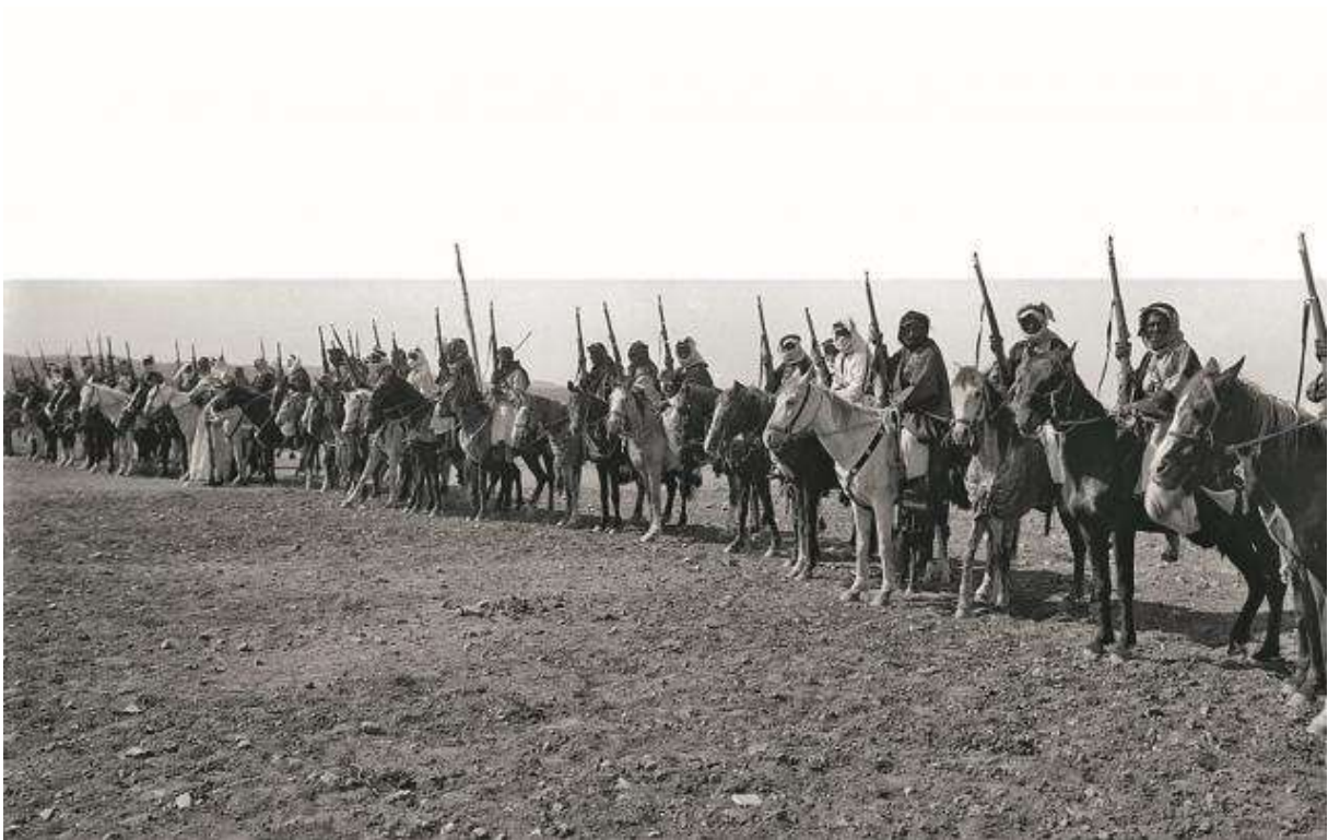
Cavaliers arabes sur la ligne Sykes-Picot (DR)

18 : les Allemands rejettent une proposition américaine de conférence de la paix