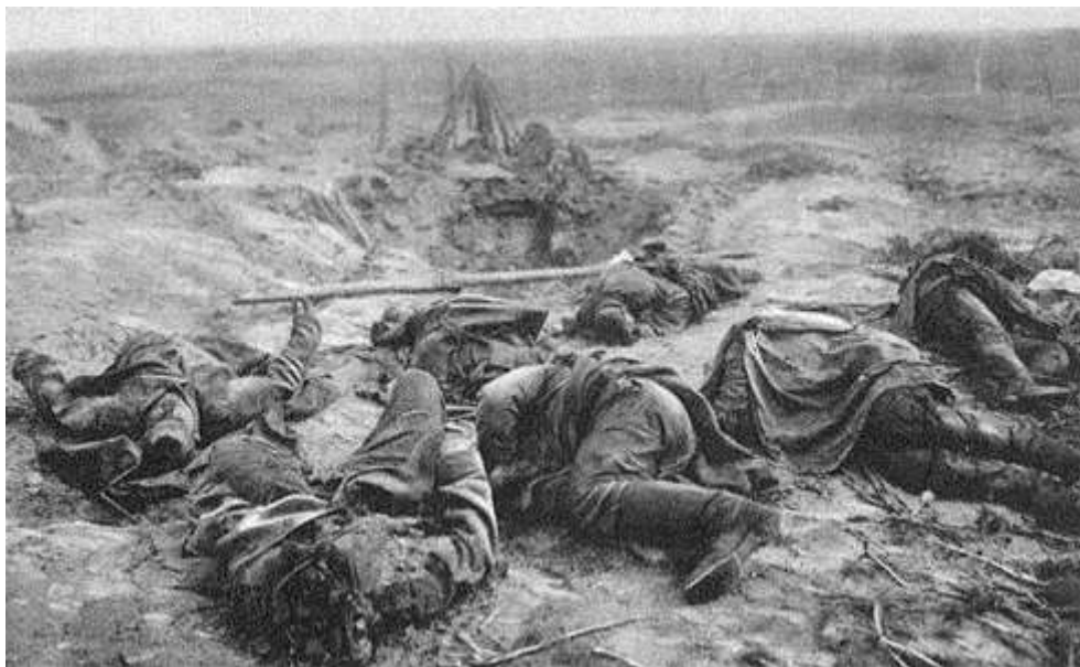
Quelque part sur le front de Verdun

30 : Verdun : RG : on signale quelques refus d'obéissance chez les Français Nouveau recul français sur les Caurettes et au sud de Cumières