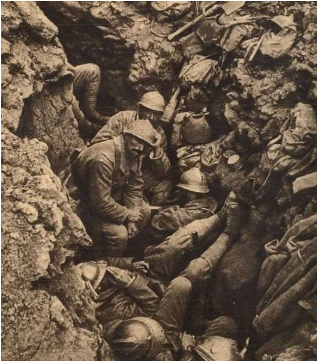
Une escouade dans une tranchée de la Côte 304