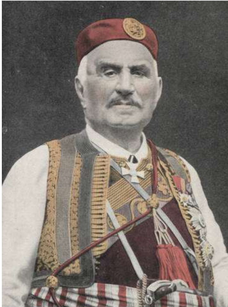
Nicolas 1 er - Roi du Monténégro