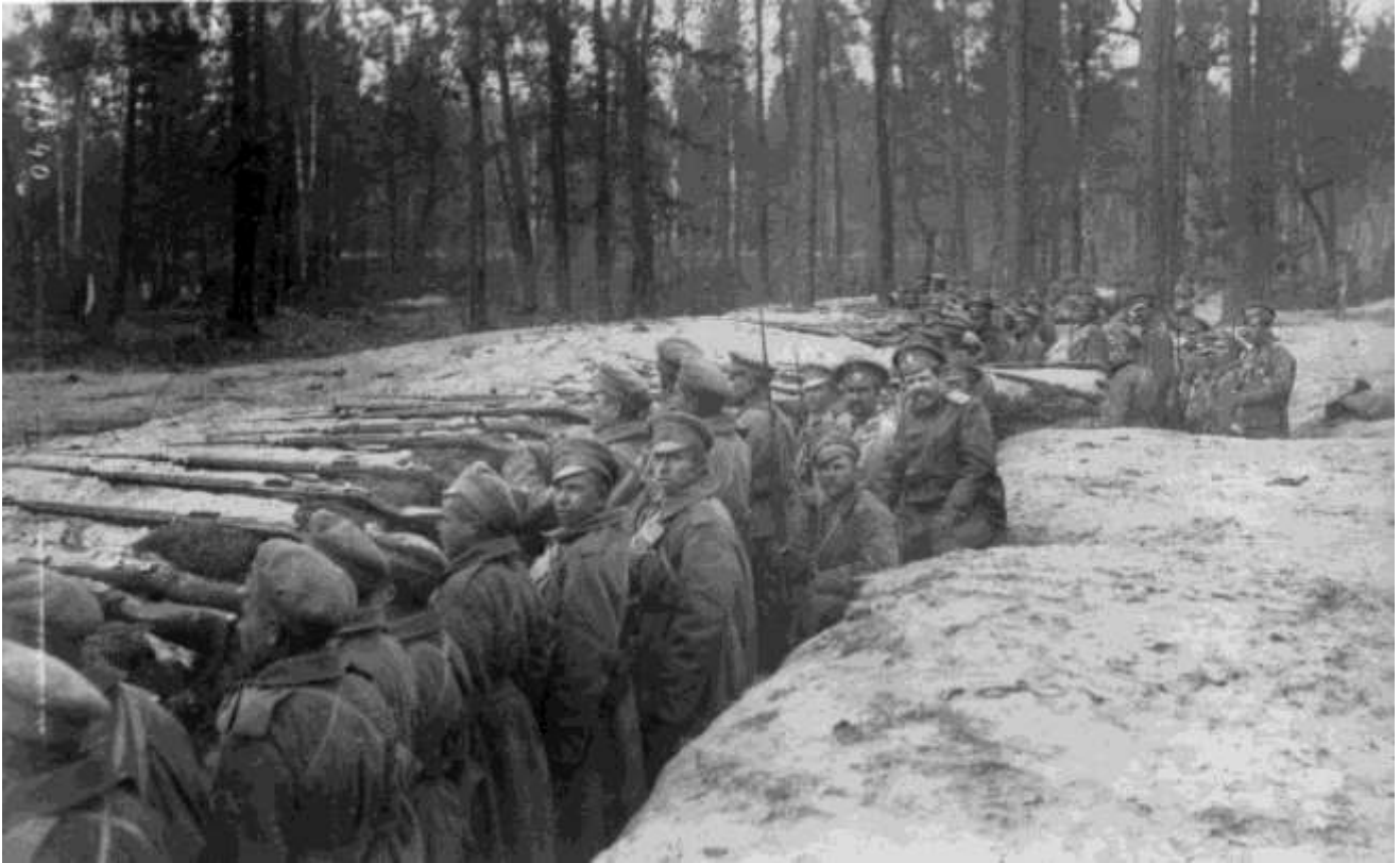
Infanterie russe