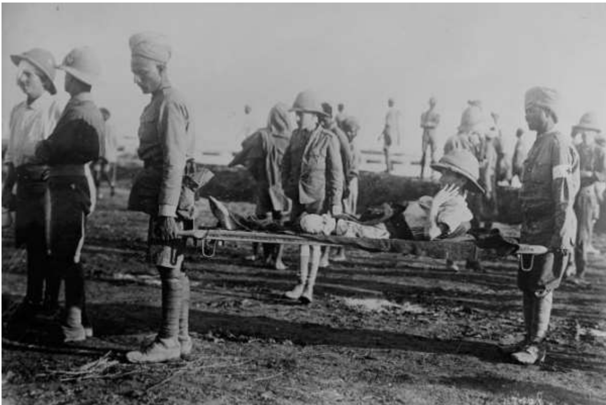
Blessés britanniques à Kut-El-Amara