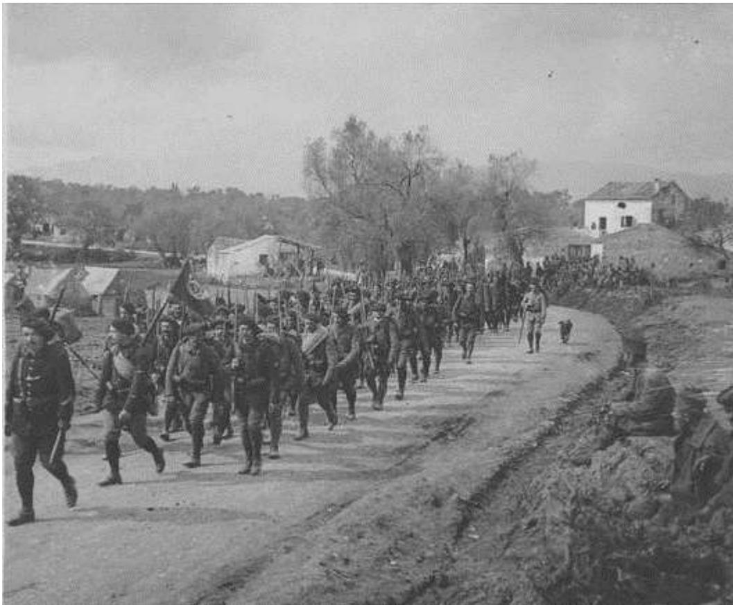
Le 6 ème Bataillon de Chasseurs Alpains – secteur de Corfou (Opendata)