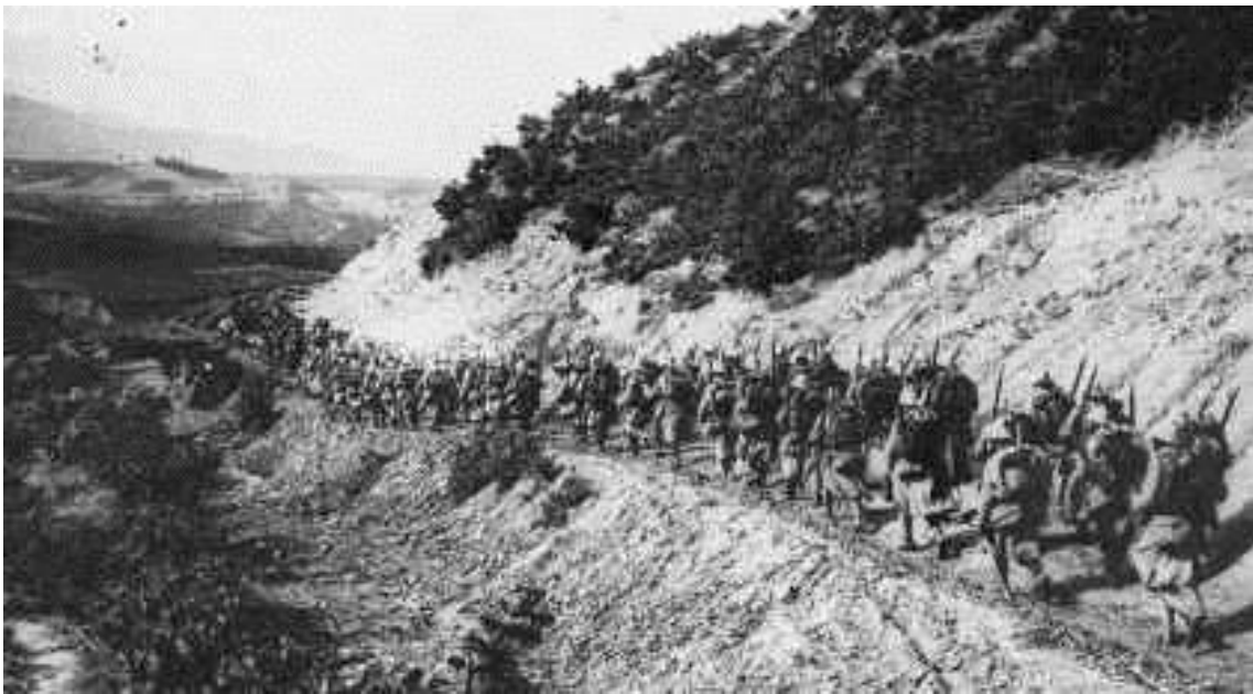
Colonne d'infanterie française – secteur de Salonique