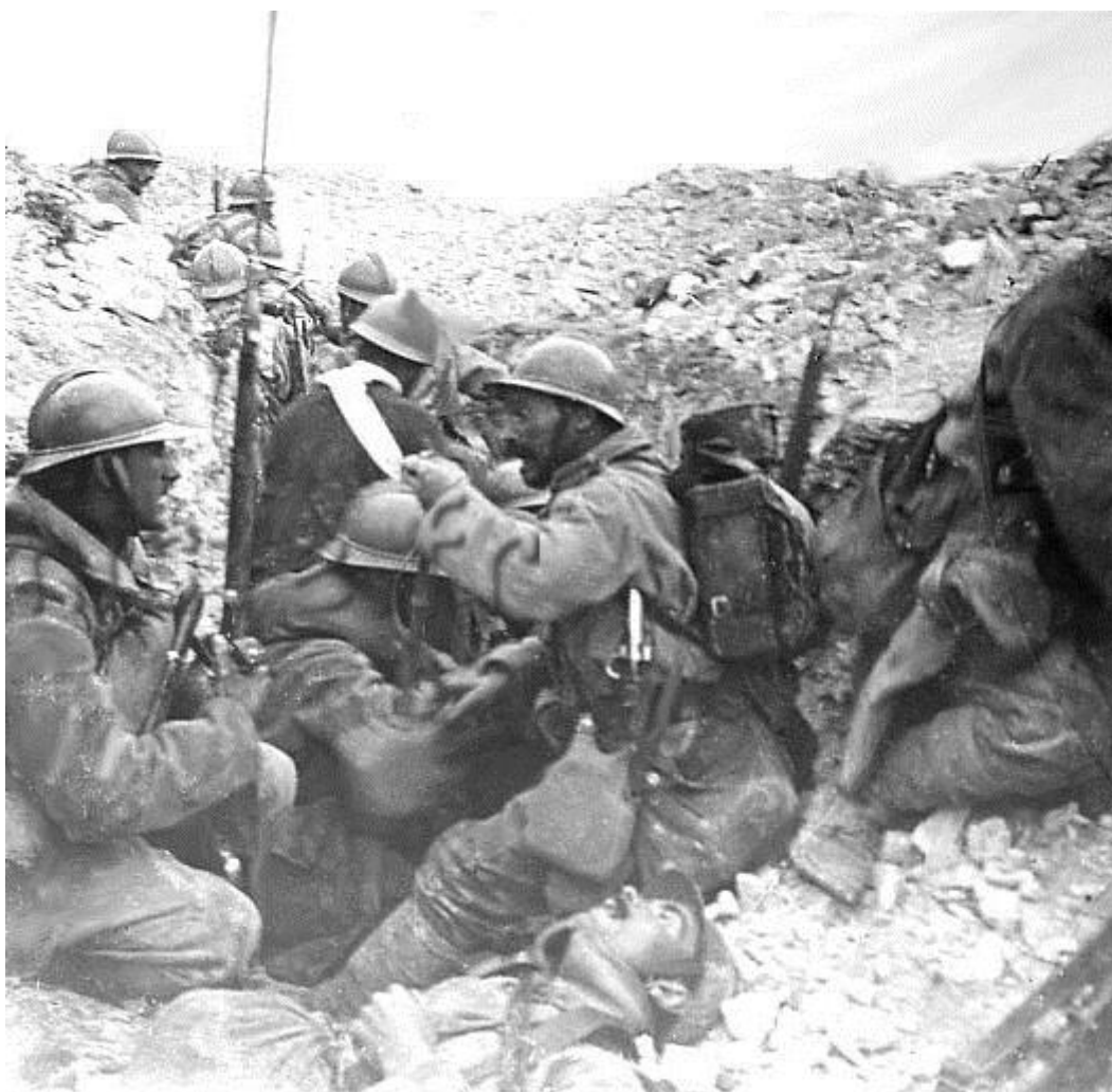
Fantassins dans une tranchée à Souain