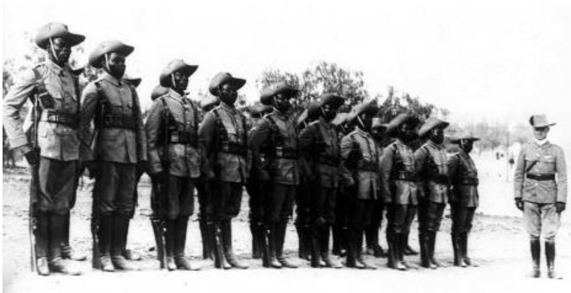
Supplétifs camerounais servant dans l'armée allemande