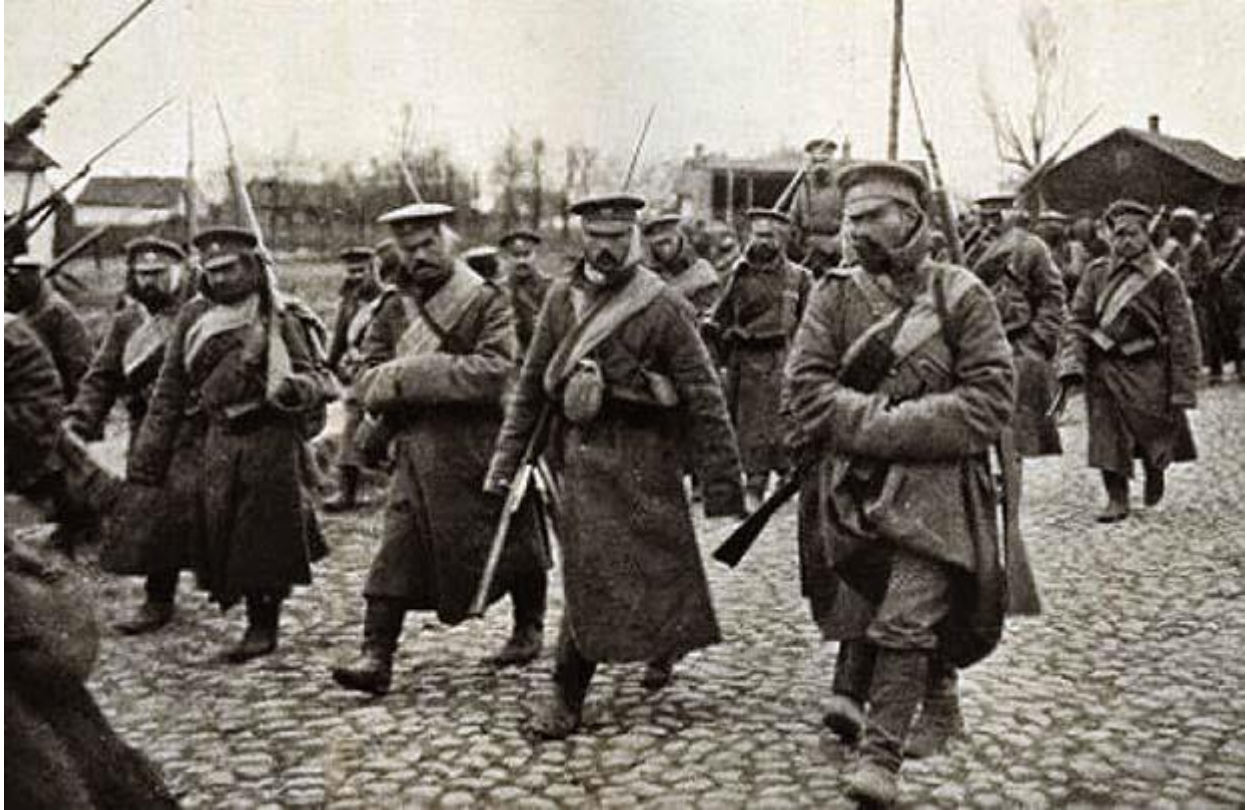
Soldats russes secteur – secteur du Dniestr – (DR)

24/12/15 – 16/1/16 : offensive russe sans succès entre la frontière roumaine et le Dniestr