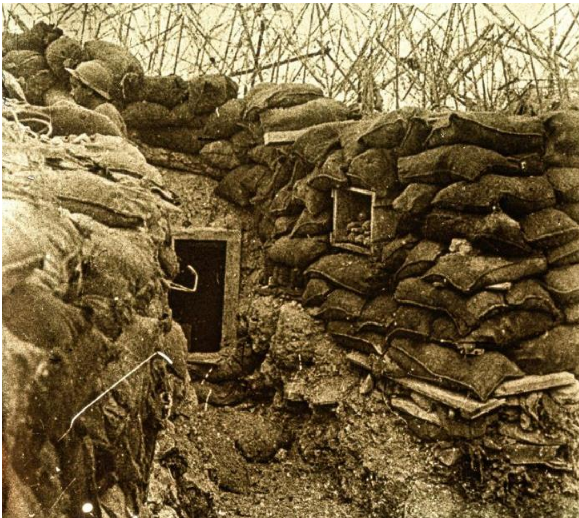
Tranchée française au Mont Têtu (DR)

14 : échec d'une attaque allemande sur le Labyrinthe (entre La Targette et Neuville-Saint-Vaast ; Pas-de-Calais)