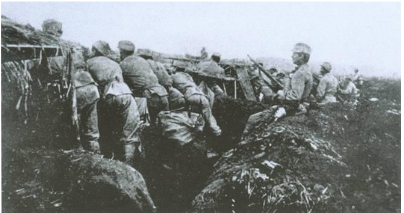
Infanterie austro-hongroise faisant le feu contre les troupes russes (Ukrmap)