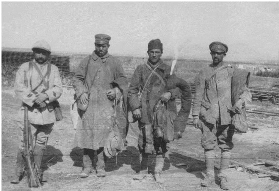
Prisonniers bulgares et caporal français

9 : Serbie les Français occupent Mrzea, Krusevica (aujourd'hui en République de Macédoine) et Siskovo, à l'ouest de la boucle de la Tchernia