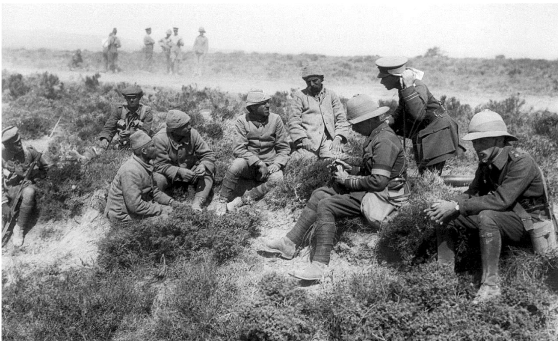
Prisonniers turcs interrogés par des officiers anglais