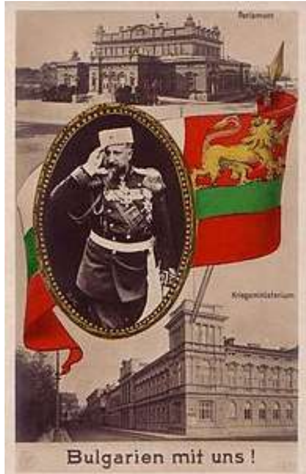
La Bulgarie entre en guerre aux côtés de l'Allemagne

23 : mobilisation générale en Bulgarie et en Grèce