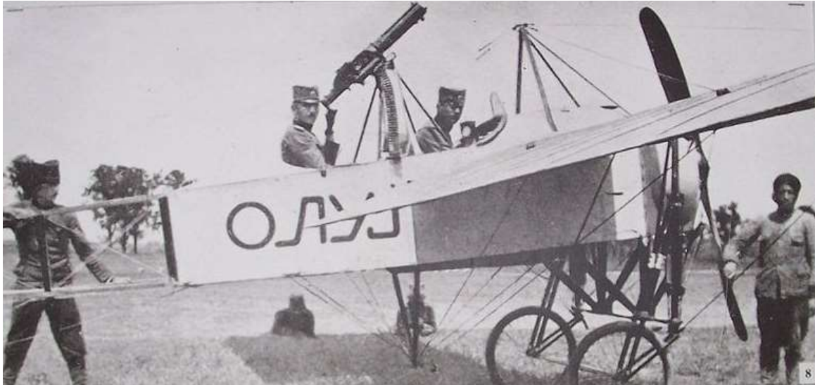
Aéroplane serbe

19 : Serbie : bombardement des positions serbes de Belgrade (aujourd'hui Beograd ; Serbie) et Semendria (aujourd'hui Smederevo ; Serbie)