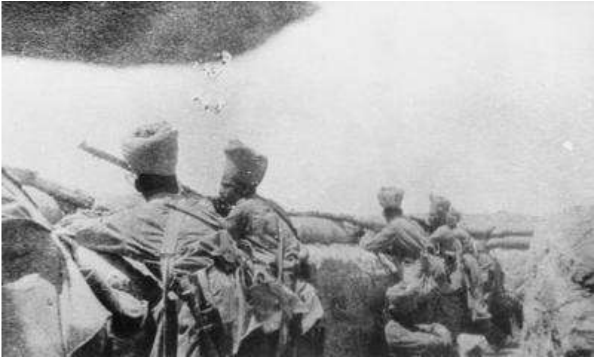
Infanterie indienne sur le front de Mésopotamie

28 : Mésopotamie : les Britanniques occupent Es-Sinn