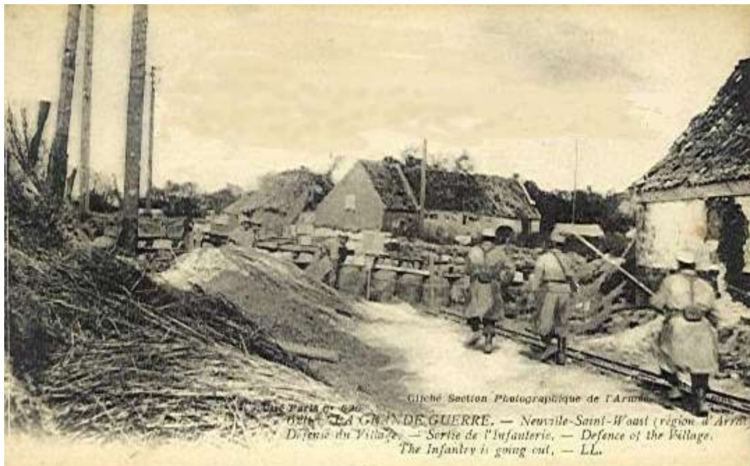
Progression d'infanterie française dans Neuville Saint-Waast

30 : fin de la 1 re phase de la 2 e bataille de Champagne