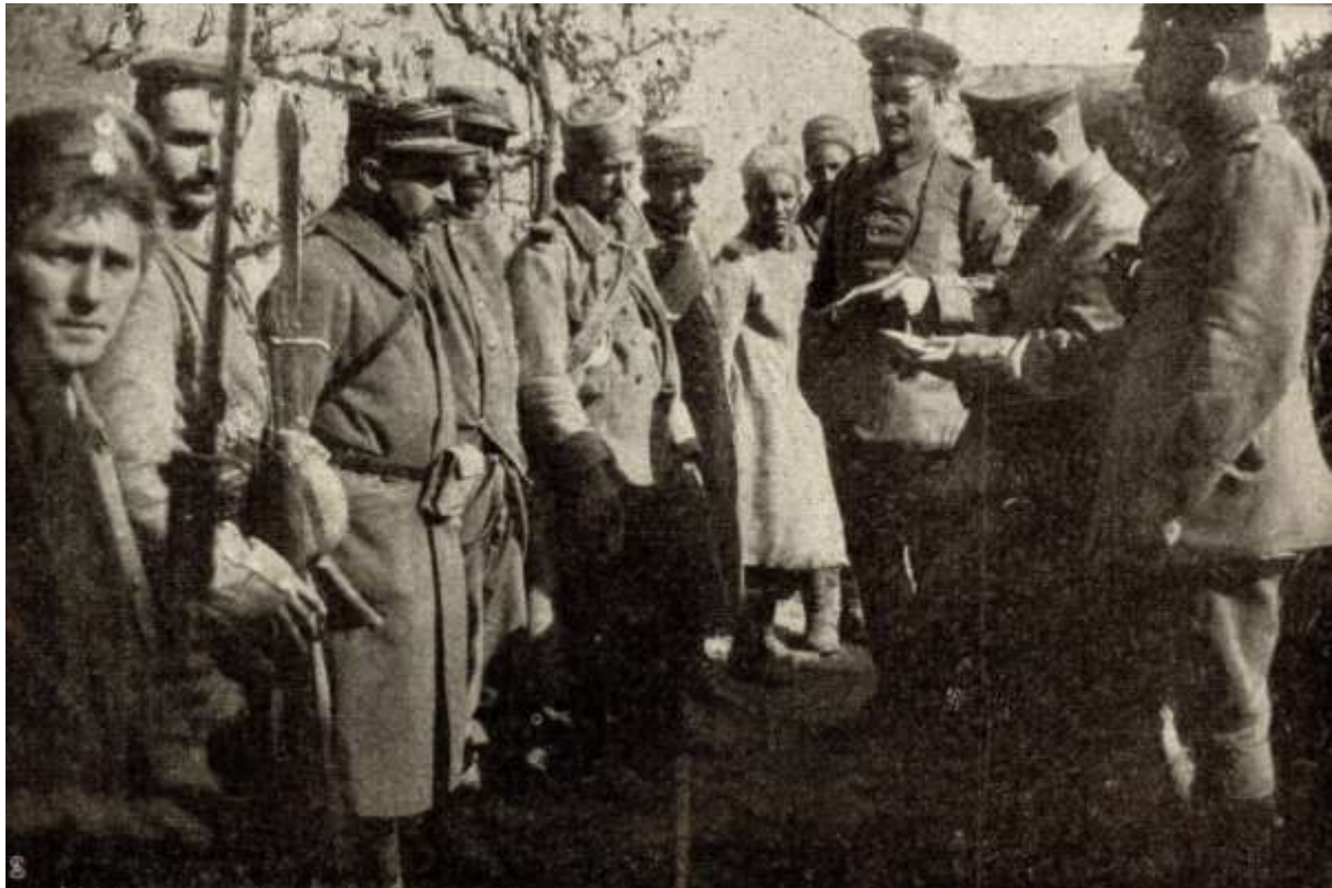
Prisonniers français dans le secteur de Vimy