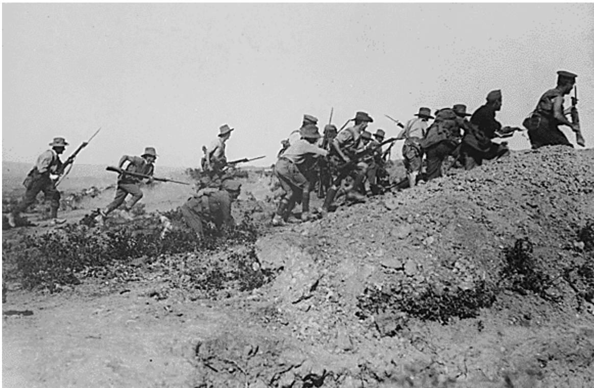
Les australiens et néo-zélandais repoussent une attaque turque à Gaba Tépé