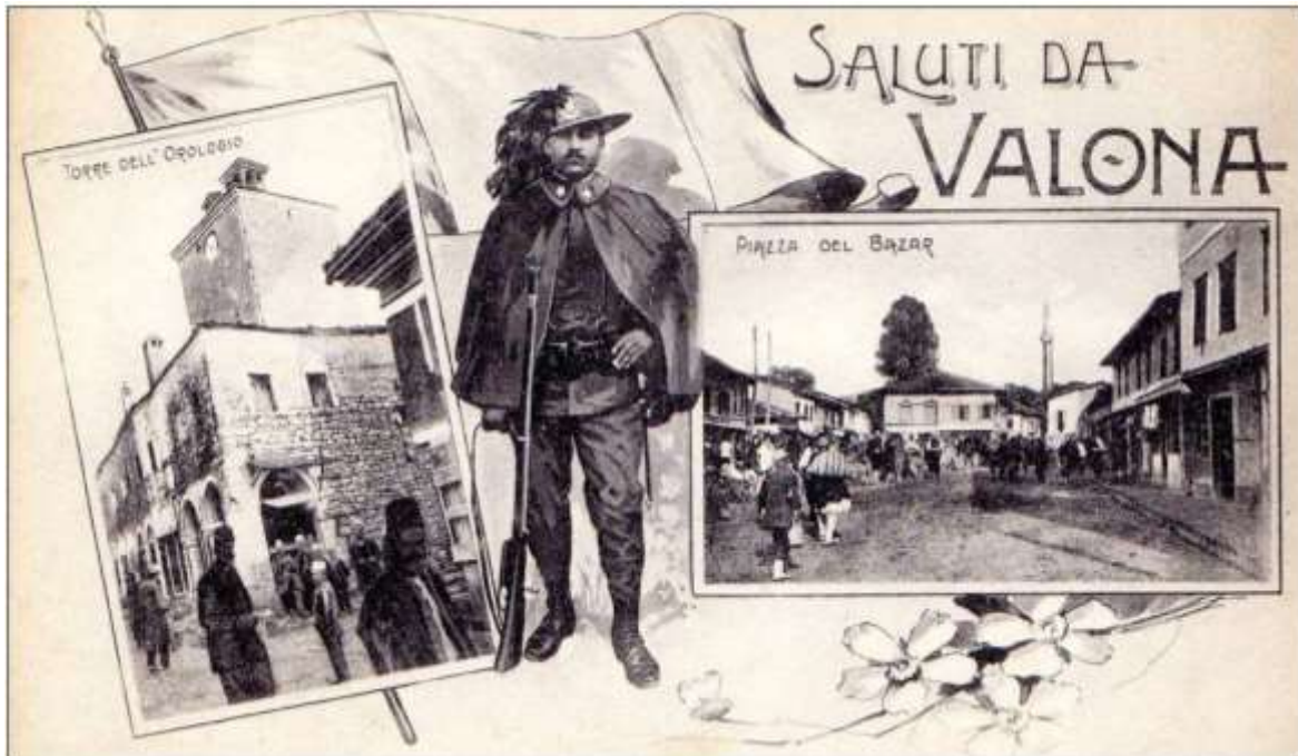
Valone est occupée par l'armée italienne

29 : les Italiens occupent Valona (aujourd'hui Vlore) en Albanie