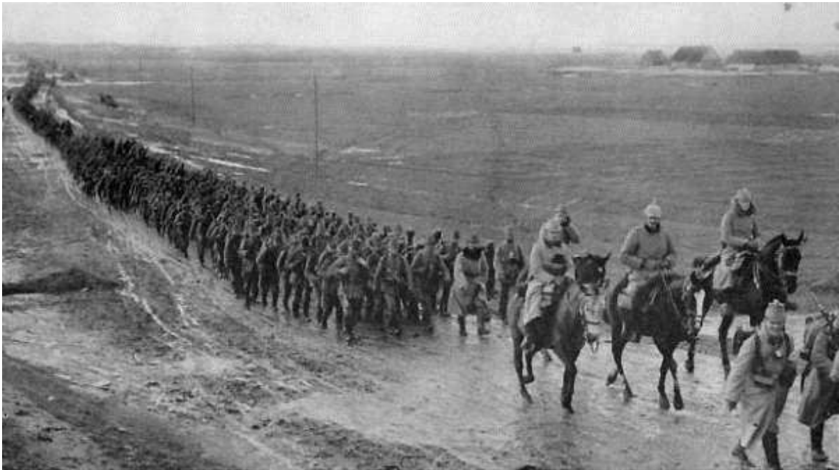
Les allemands progressent en Pologne