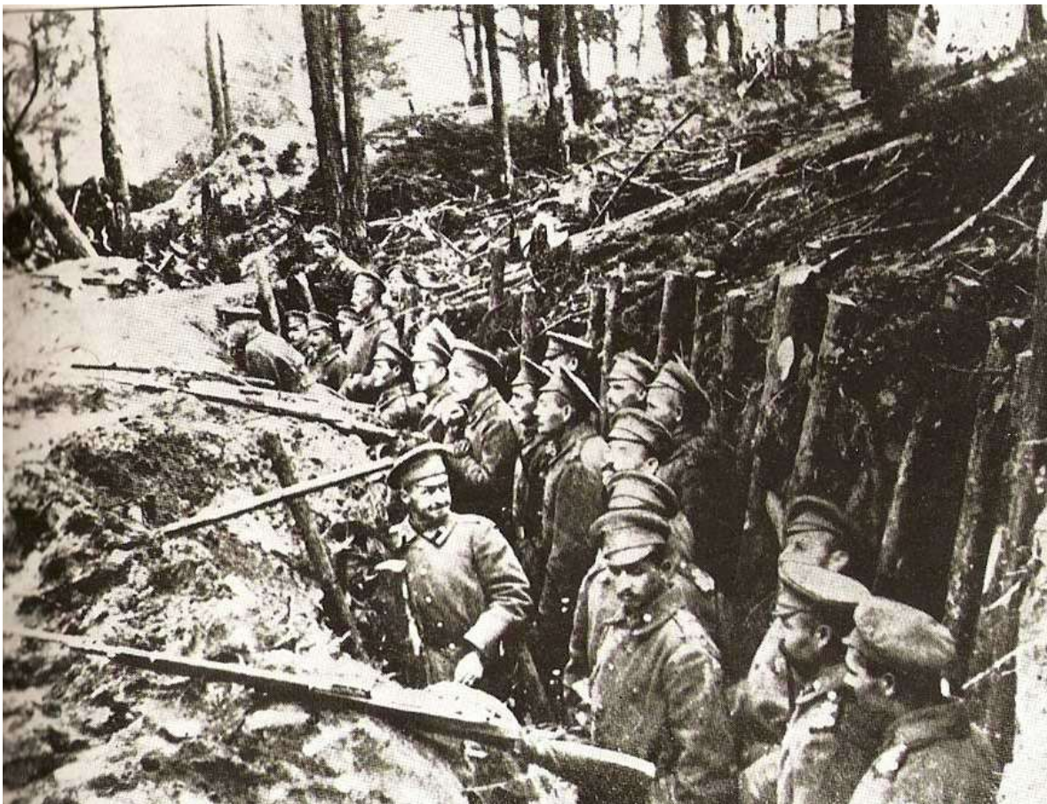
Une position russe dans les Carpates