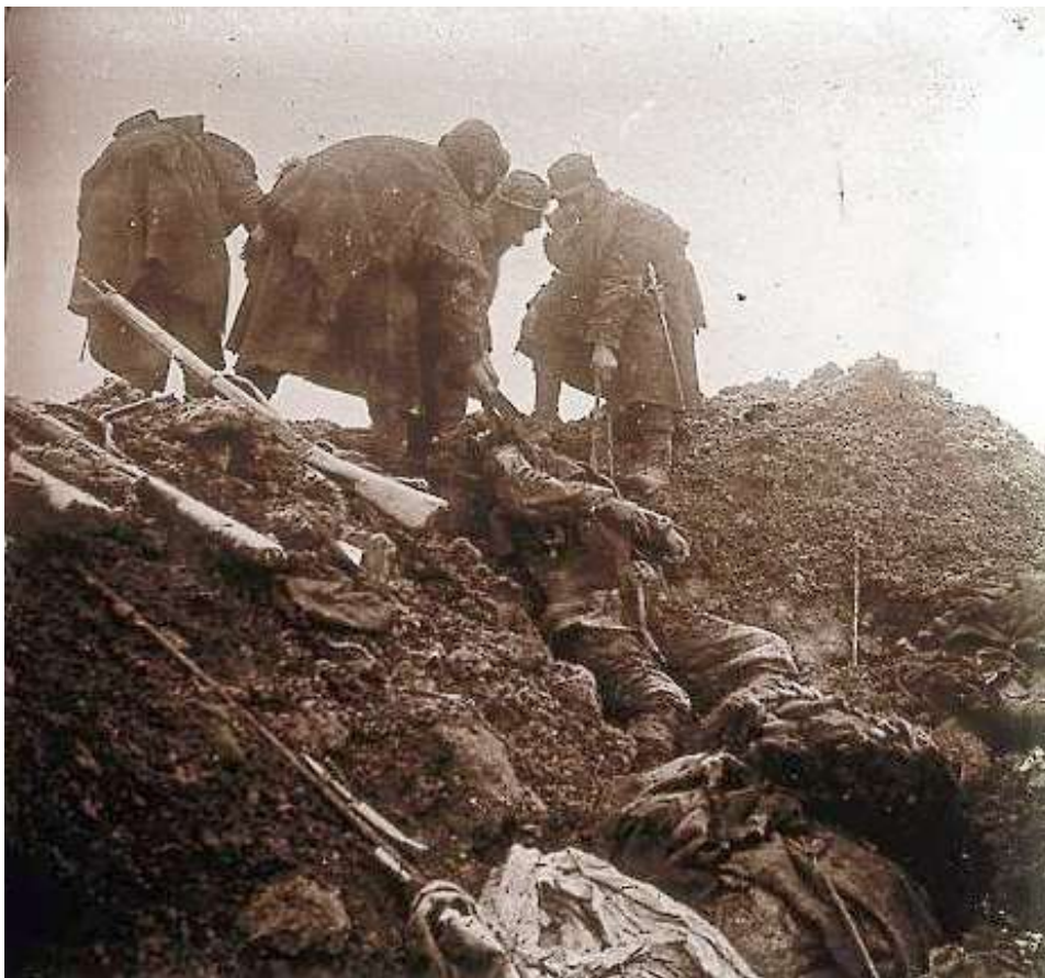
Les Eparges : on récupère les corps des copains qui n'ont pas eu de chance...