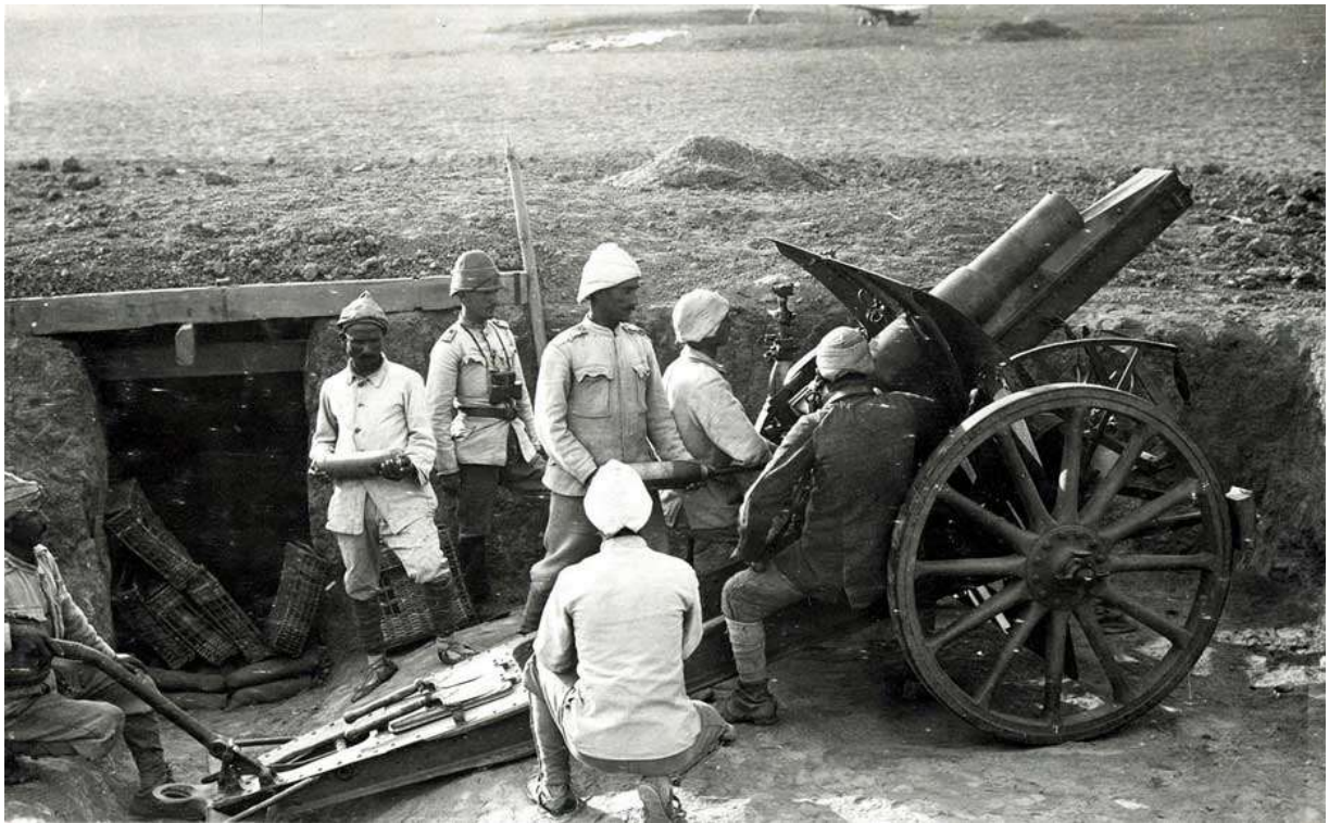
Artillerie turque en position dans le secteur du canal de Suez

22-23 : canal de Suez : nouvel échec turc à El-Kubri