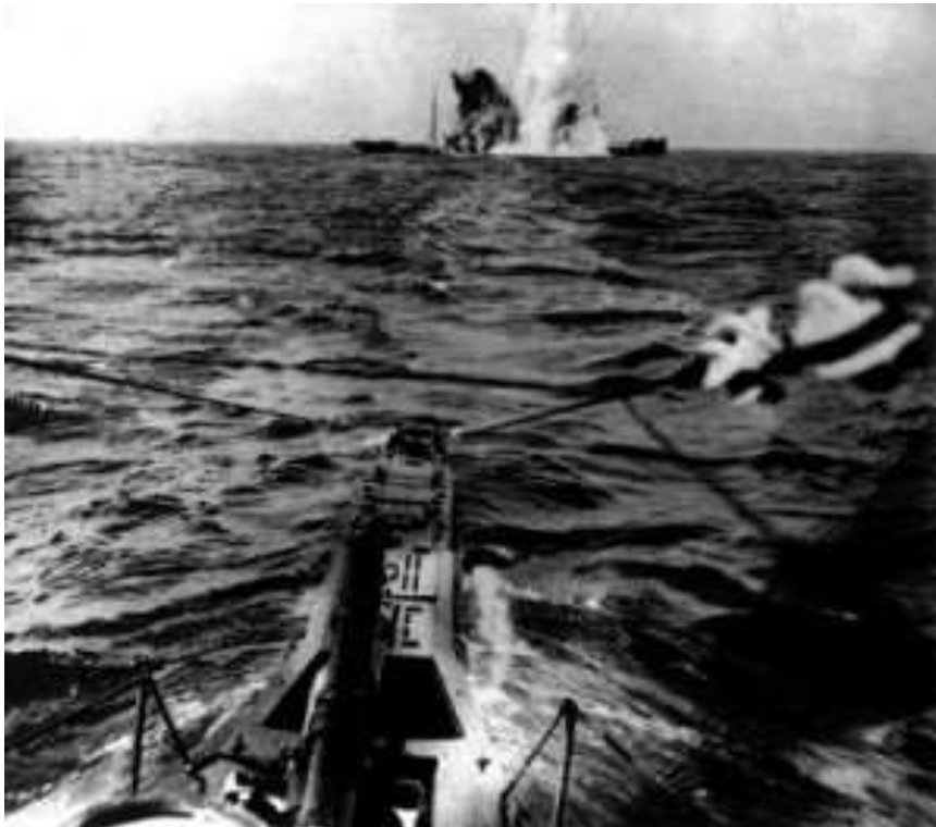
La guerre sous-marine s'intensifie

20 : les Alliés acceptent les conditions territoriales mises par l'Italie à son entrée en guerre