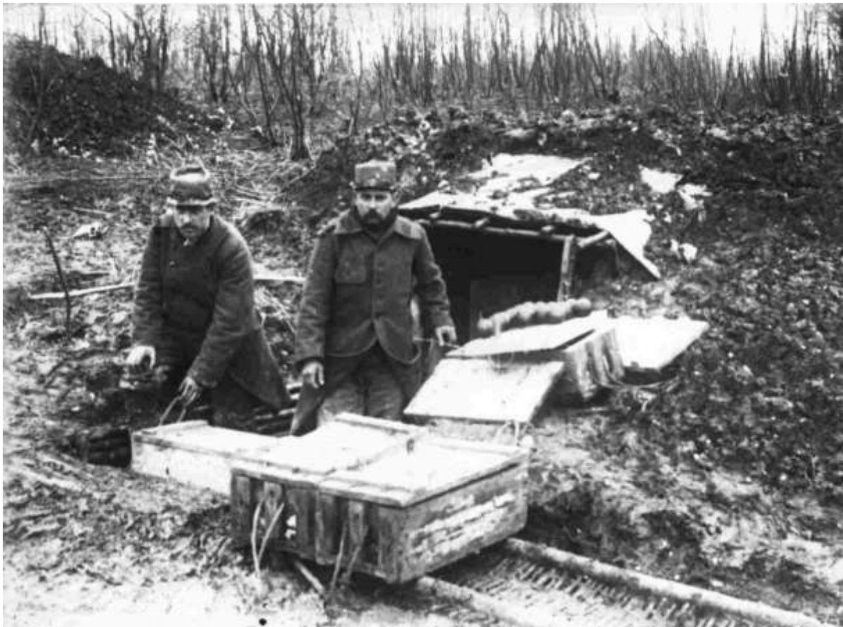
Deux Poilus faisant le ravitaillement à un dépôt de grenades à Notre Dame de Lorette