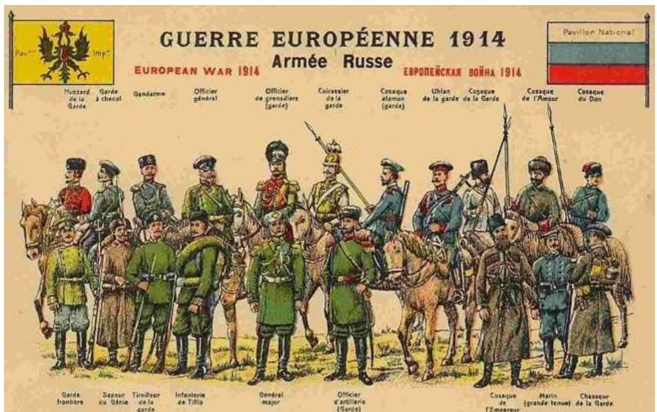
Uniformes de l'armée impériale russe

31/1-4/2 : Pologne : bataille de Bolimov sur la Ravka : l'A.O.K. 9 utilise pour la première fois des gaz de combat