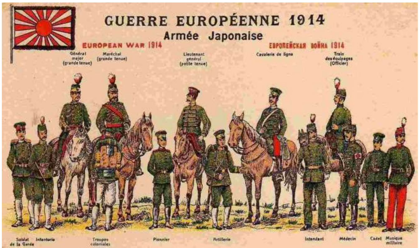
Uniformes de l'armée impériale japonaise

18 : le Japon propose à la Chine le traité « des 21 demandes » visant à faire de ce pays un protectorat japonais