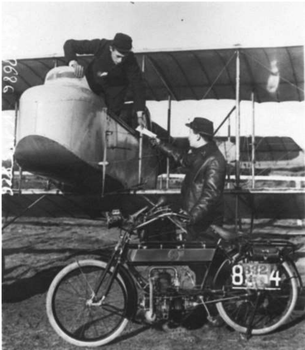
Transmission des ordres avant une mission de bombardement