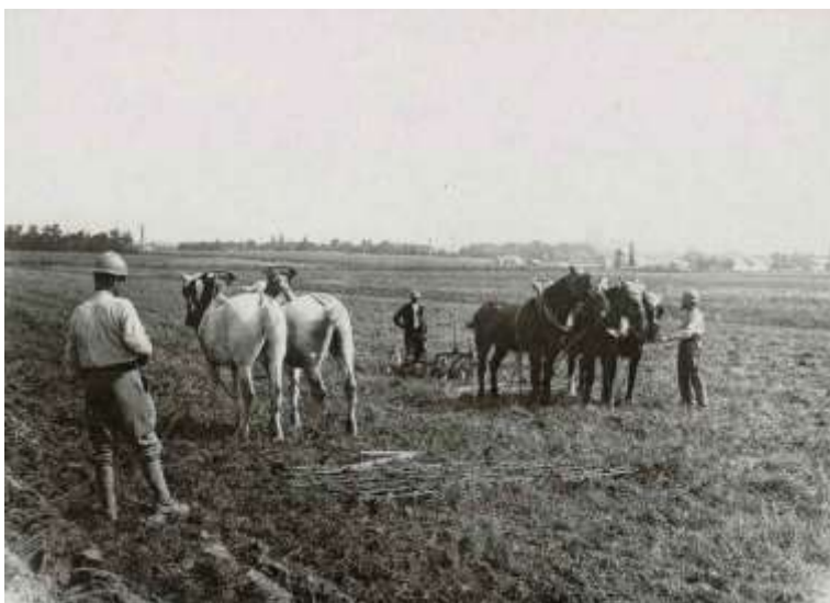
Loin du front, les permissions agricoles reprennent

Le Corps reçoit 1 sergent de la 10 ème Cie du 115 ème RIT ; placé à la 3 ème Cie.