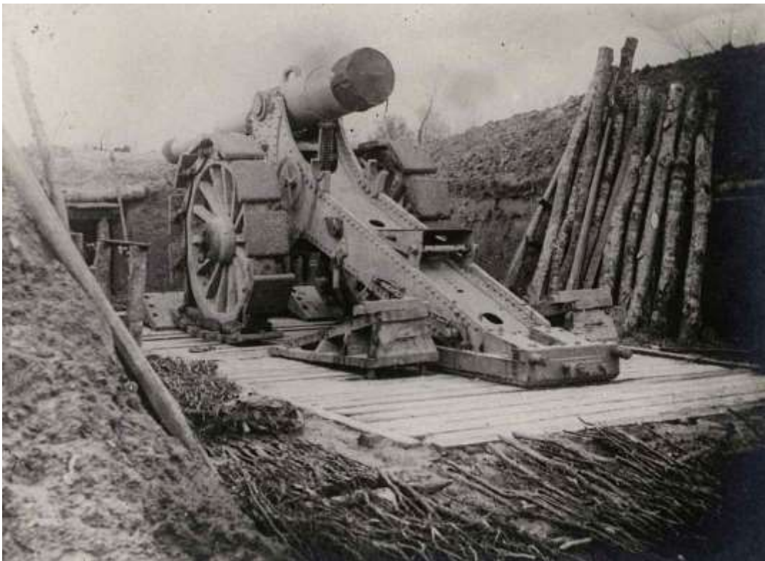
Une pièce d'artillerie lourde française

Tir violent de 150mm (180 coups environ) sur une de nos batteries d'Artillerie Lourde en position entre Falkwiller et Traubach.