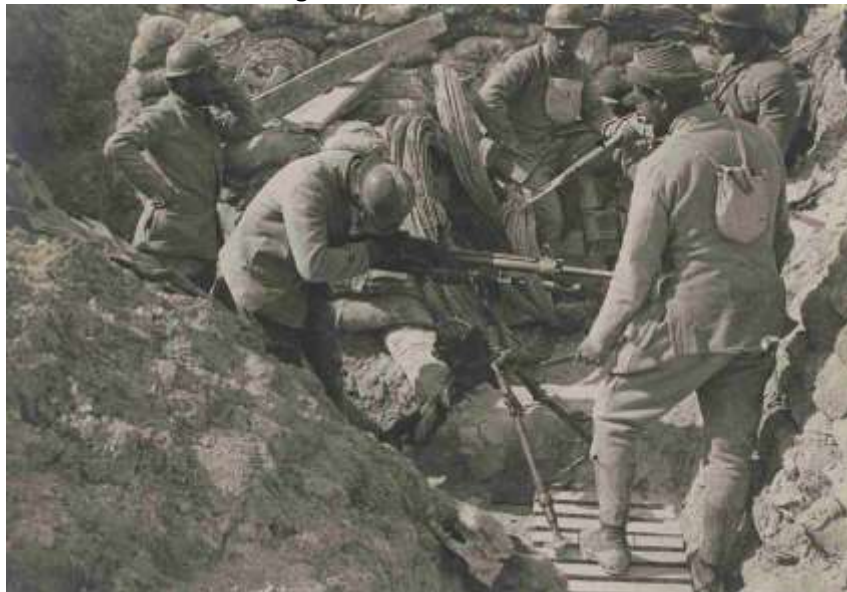
Mise en place d'une mitrailleuse Saint-Etienne Mle 1907

Cie Mitrailleuses : 2 sections en ligne et 2 en soutien