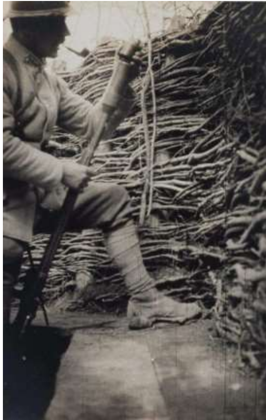
Chargement d'un lance-grenade Vivien-Bessières

Le 27 mai, à 2 h, l'ennemi exécute un tir d'encagement sur le Ponceau. A 2 h 15, allongement de ce tir sur nos 2 èmes lignes. Nous faisons aussitôt déclencher le barrage d'artillerie. Nos V.B. et Guidetti (lance-grenades) arrosent le Ponceau. Nos mitrailleuses balayent le terrain avoisinant.