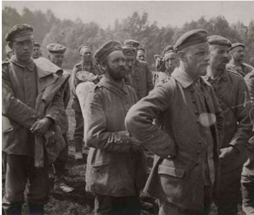
Prisonniers allemands

Au total 10 prisonniers dont 1 Officier appartenant au 418ème IR et au 400ème IR sont amenés dans nos lignes. 6 Allemands ont été certainement tués.