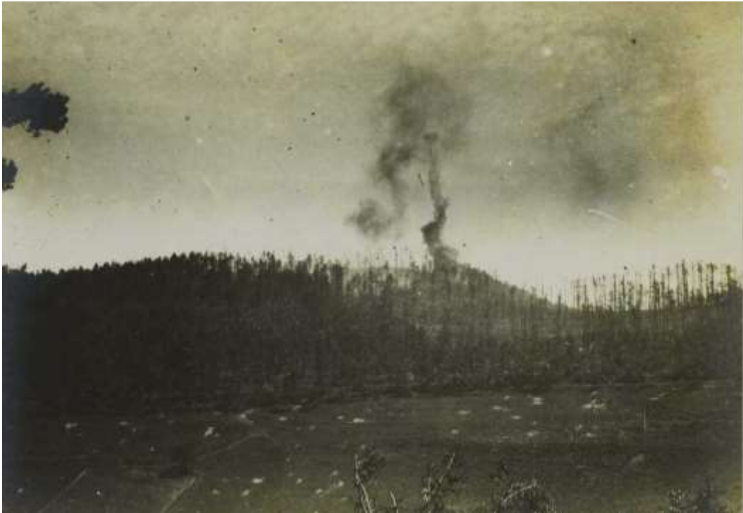
Tir français sur les positions allemandes de Reichacker