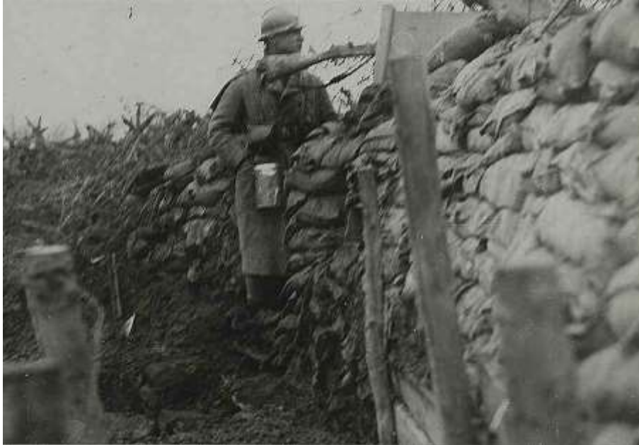
Guetteur en position dans une tranchée

Le 5 mai, aucune activité spéciale de part et d'autre ne vient troubler le calme relatif. Dans la soirée, 2 Btms du 295 ème R.I. relèvent les 4 ème et 5 ème Btms du 256 ème R.I. dans les CR de Pfannesthiel et de Gildwiller. Le 4 ème Btm se rend à Uberkumen et Falkwiller, le 5 ème à Hecken Dieffmatten.