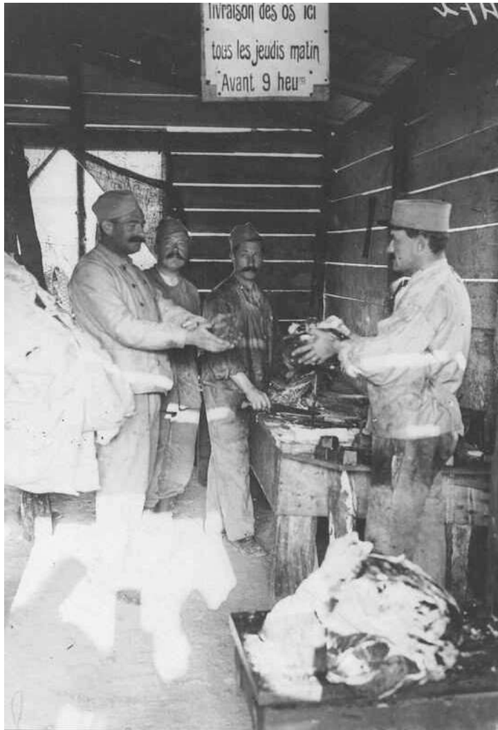
Boucherie militaire à Jonchery