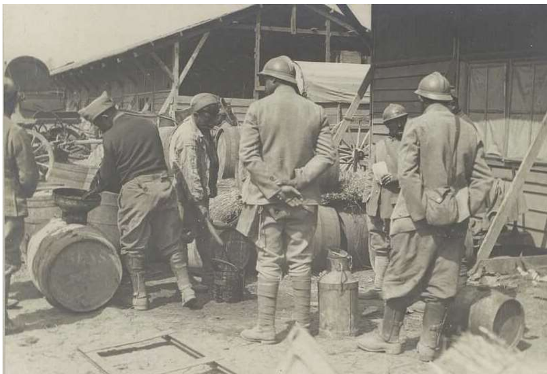
Le ravitaillement en « pinard » en gare de Prouilly le 1 er mai 1917

Le 3 mai, la 4 ème Cie, stationnée à la Fourche de Prouilly depuis le 13 avril vient cantonner à la Ferme de Luthernay. Elle est mise à la disposition du Lt Courson Cdt le Groupement K.