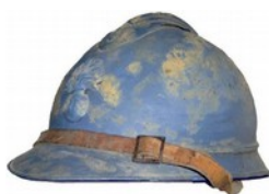
ASSOCIATION "POUR CEUX DE 14" Mémoire bourguignonne de la Grande Guerre