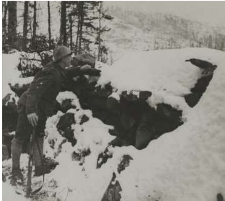
En observation des lignes ennemies

Le 22 février, un soldat venant du 43 ème RIT est affecté à la 7 ème Cie. Le Cne Granger, venu du Dépôt du Corps, prend à la date de ce jour le commandement de la 3 ème Cie.