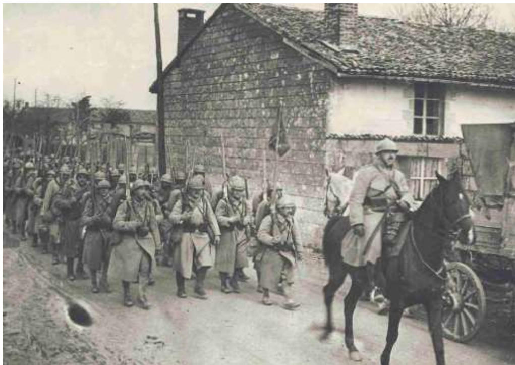
Une compagnie d'infanterie arrive à Saint-Hilaire

Le 4 février, 2 Poilus sont blessés bien que la journée soit mentionnée comme étant calme.