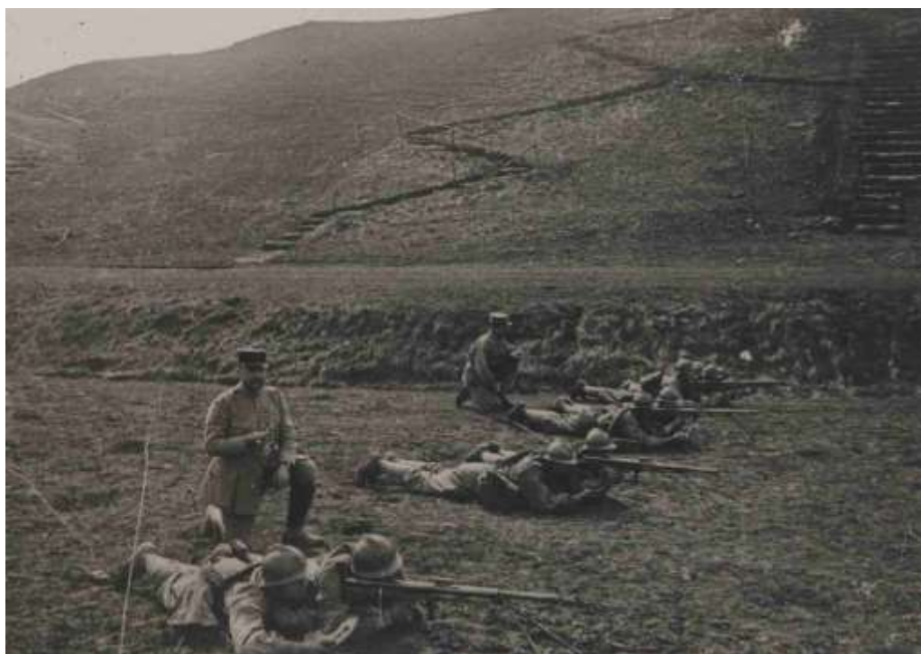
Instruction au tir avec le fusil-mitrailleur

Le 8 février, des instructions sont reprises dans les unités.