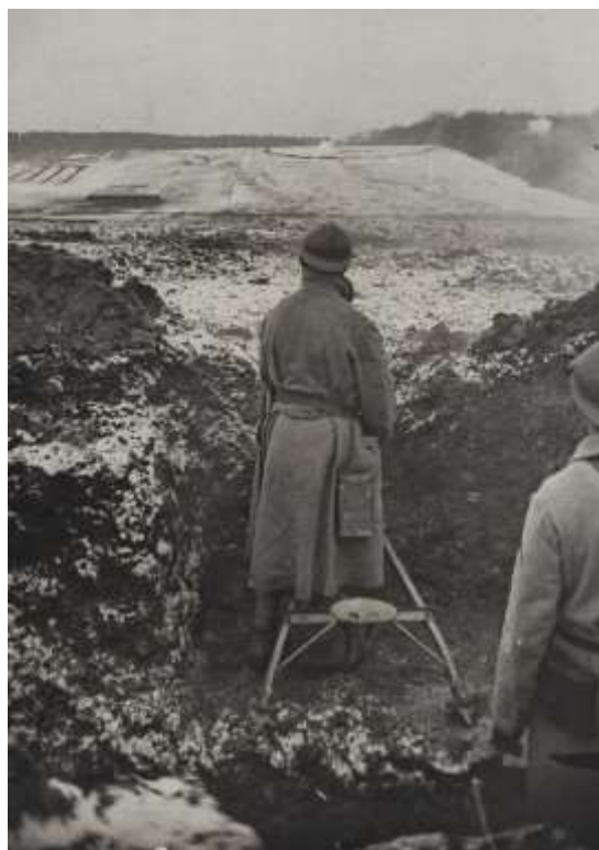
Exercice de tir de précision

Le 1 er février 1917, le Régiment est au repos. Des séances d'instructions diverses sont dispensées dans les unités.