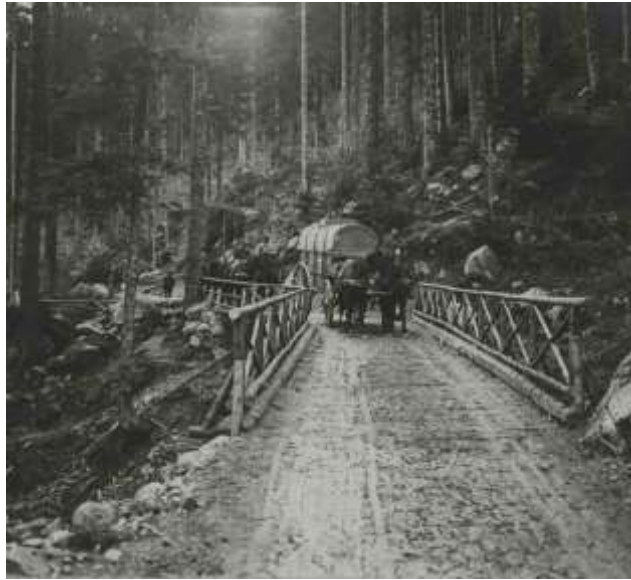
Le ravitaillement arrive au sous-secteur de Gascheney

Une section de la 1 ère CM vient en réserve à Camp Robert, le 12 février 1917.