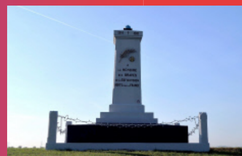
Après la restauration