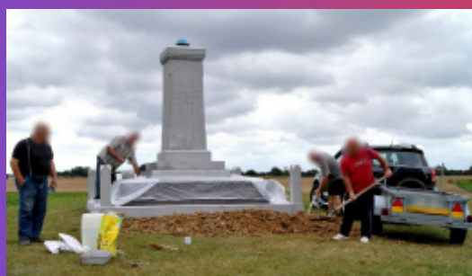
Pendant la restauration