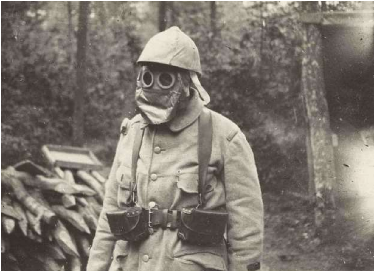
Le masque à gaz, dérisoire protection contre les gaz

Le lendemain matin, des roulements d'autos sont entendus entre 4 h 30 et 5 h 30 à l'arrière des positions allemandes. Ces positions étant jusqu'ici utilisées par des convois hippomobiles, tout porte à croire que ces bruits de moteurs devaient correspondre à ceux d'ambulances transportant un grand nombre de gazés.