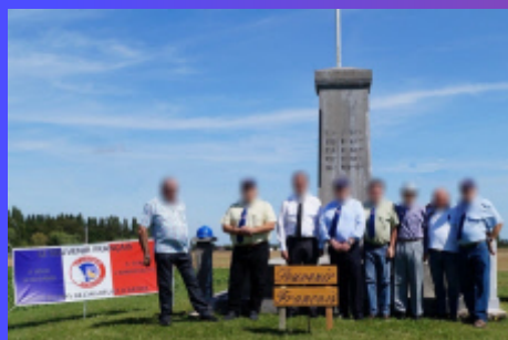
Avant la restauration

! Rendez-vous à la page 14 pour survoler le champ de bataille et le monument !