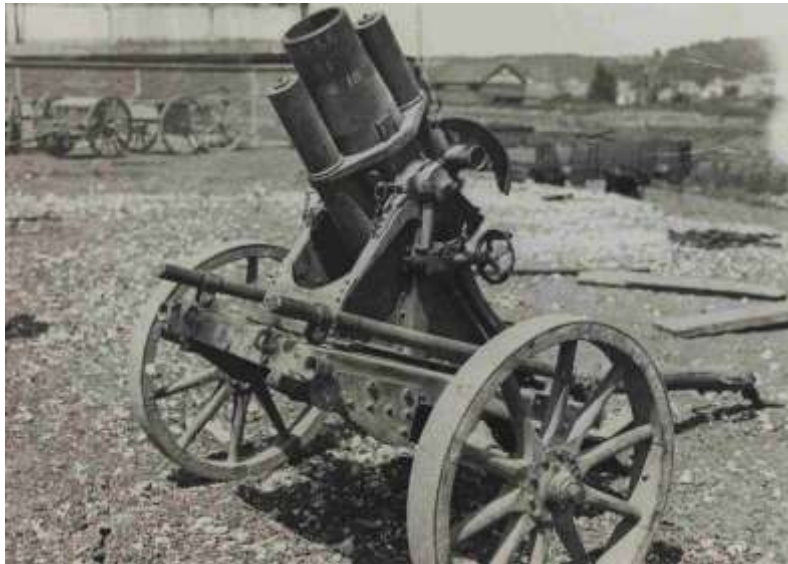
Minenwerfer de 170mm

Le lendemain est plus calme et permet d'effectuer des relèves. A 20 h, le 5 ème Bataillon bis est relevé dans les lignes A et B par le 6 ème Bataillon (23 ème et 24 ème Cie en A ; 21 ème et 22 ème en B) et se porte en réserve de secteur fermes Boudry, Vandamme, Marie-Jeanne et Paradou. Le 5 ème Bataillon va occuper la ligne des C. Ces relèves s'effectuent sans incident. 1 Poilu est blessé le 15 avril.