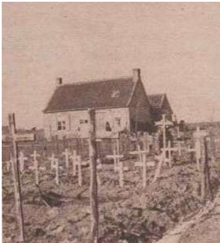
Cimetière militaire à Boesinghe

La suite sera consultable dans notre édition du mois de mai 2016