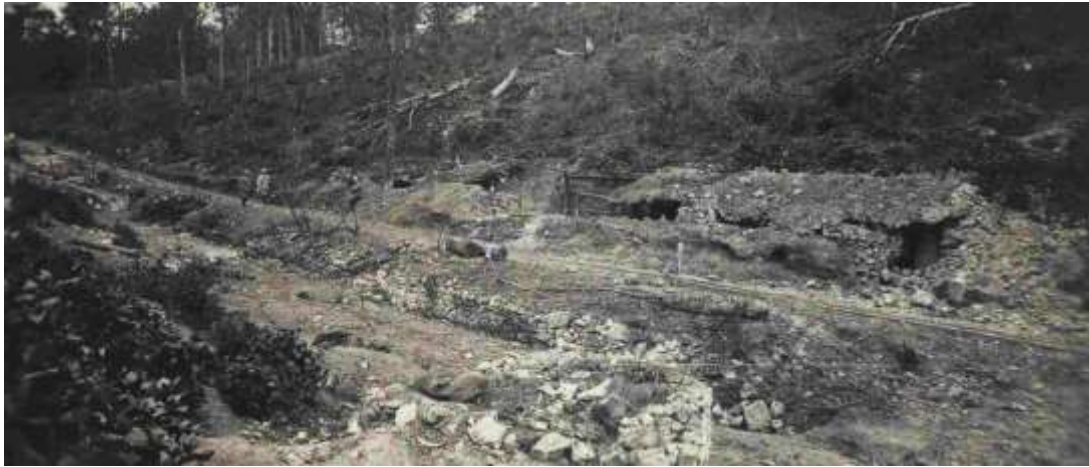
Cuisines dans le bois de Chauvencourt après un bombardement

Du 21 au 23 avril, le 2 ème Bataillon essuie des tirs de l'artillerie, ainsi qu'une attaque à hauteur d'un poste d'écoute en face de Chauvencourt. 1 Poilu est tué et 10 autres hommes sont blessés dont un adjudant.