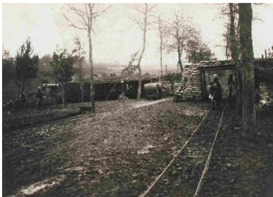
Cantonnement face au bois de la Hazelle

Le lendemain, 6 Poilus sont blessés sur différents secteurs tenus par le 259 ème RIT. 3 hommes de la 1 ère Cie, sont blessés par éclats d'obus à Flirey, et 2 autres de la 7 ème Cie, sont blessés par éclats d'obus à la Voisogne, tandis qu'un autre de la 6 ème Cie est également blessé par éclats d'obus au Bois de la Hazelle.