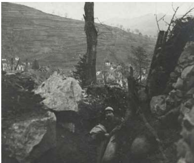
Tranchée à Ampferbach (BDIC – fond Valois)

Le 21 avril, le groupe de pionniers bombardiers est détaché à Eck pour travaux dans boyau Eck – Ampferbach. Un nouveau renfort provenant du dépôt de Chalon-sur-Saône arrive au Régiment. Il est constitué d'un sergent, 2 caporaux, 22 soldats.