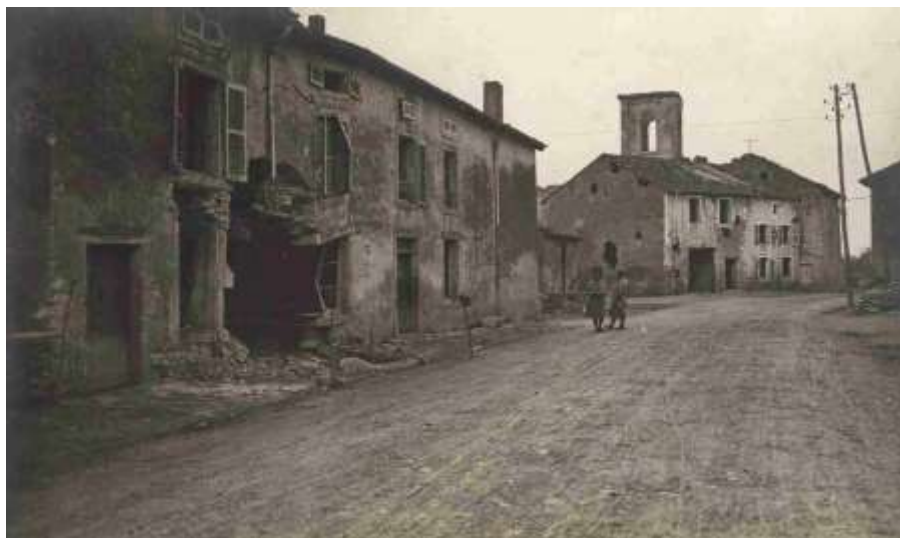
Centre de Bernécourt

Le 11 avril, la 6 ème Cie relève au Bois Jury la 7 ème qui va occuper les abris du Bois de la Hazelle. La 9 ème Cie relève à Flirey la 11 ème Cie qui rentre à Bernécourt.