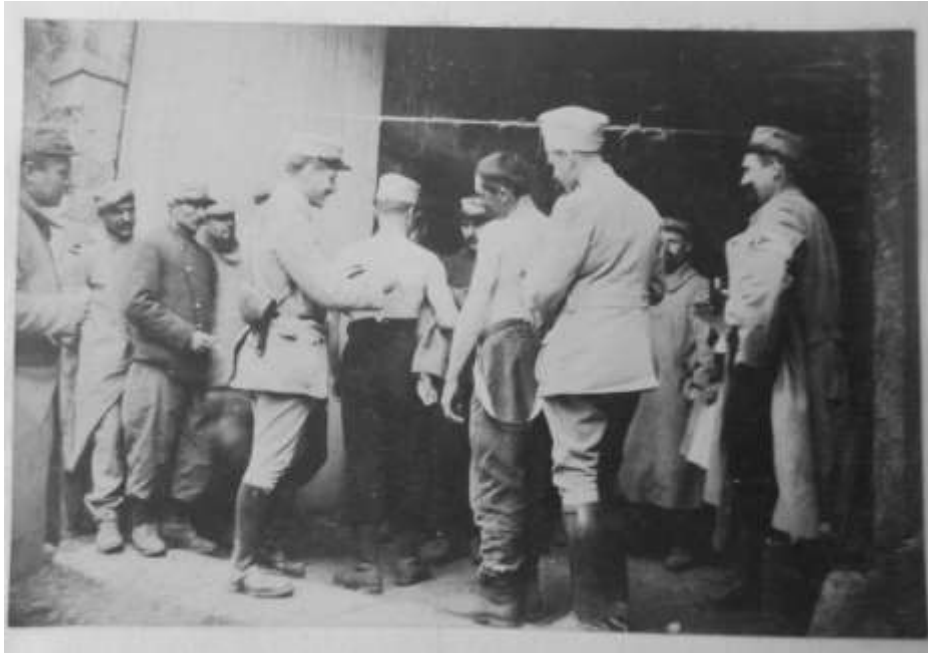
Campagne de vaccination

Le 9 avril, une nouvelle campagne de vaccination antiparatyphique (2 ème piqûre) pour les hommes de la 1 ère Cie, suivie du même rappel pour le restant du 1 er Bataillon.