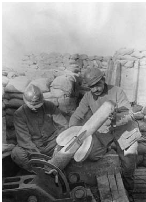
Un crapouillot

Alors que rien de particulier ne semble marquer la journée du 1 er avril 1916, le lendemain s'avère plus brutal pour les Poilus Chalonnais. A 15 h, un bombardement de minenwerfer s'abat sur les positions du 56 ème d'Infanterie, endommageant la tranchée de 1 ère ligne de la Retirade et ensevelissant un crapouillot.