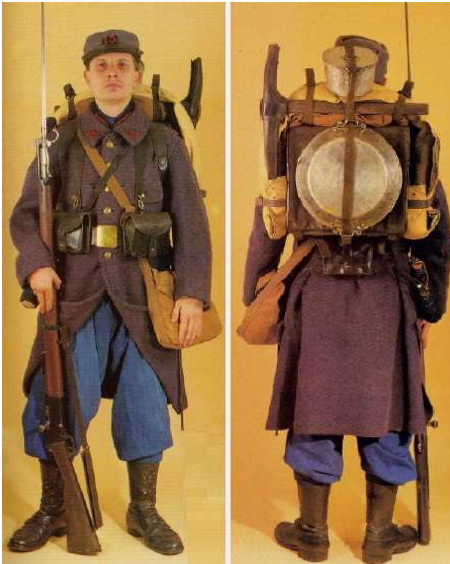
Le Poilu de l'hiver 1914 (Revue Militaria Magazine n°19) Remerciement à François Vauvillier pour cette gracieuse contribution

Abandonnant le pantalon garance pour adopter un pantalon bleu moins voyant, le fantassin français, bien que moins visible qu'il ne l'était depuis août 1914, n'en est pas moins totalement non préparé pour subir un hiver vigoureux. Cependant, il surmontera cette grave lacune de l'intendance militaire et complétera dans bien des cas son uniforme par des vêtements envoyés par sa famille (écharpe, gants, pull, etc...).