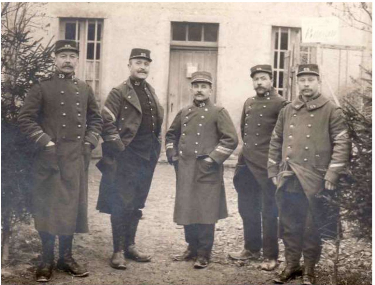
Des sergents et sergents-majors du 59 ème Territorial

Non représentative de l'ensemble des années de guerre que va traverser le régiment, l'année 1914 reste une année très calme pour les territoriaux de Chalon-sur-Saône. Occupé dans des tâches ingrates mais cependant nécessaires au fonctionnement des armées en temps de guerre, le 59 ème Territorial a été employé à défricher des forêts, garder des places fortes ou des axes de communication en arrière de la zone des armées.