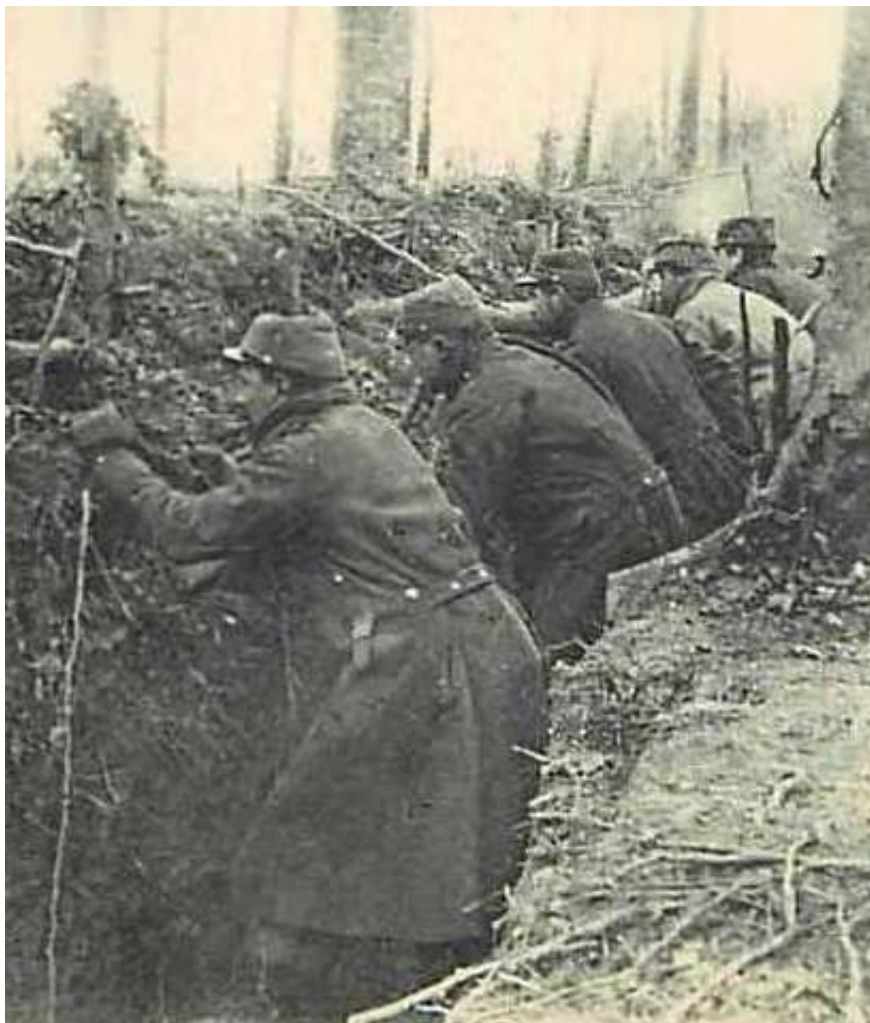
Dans une tranchée face aux Boches (G.Lelong)

Le 9 décembre, occupant toujours le même front, le régiment répartit ses unités ainsi : Mécrin 1 er Bataillon, Bois d'Ailly 2 ème Bataillon, Bois de la Vaux Ferry 3 ème Bataillon. Malgré le calme tout relatif du secteur, le 56 ème d'Infanterie y enregistre des pertes quotidiennes du fait de quelques tirs d'artillerie allemande.