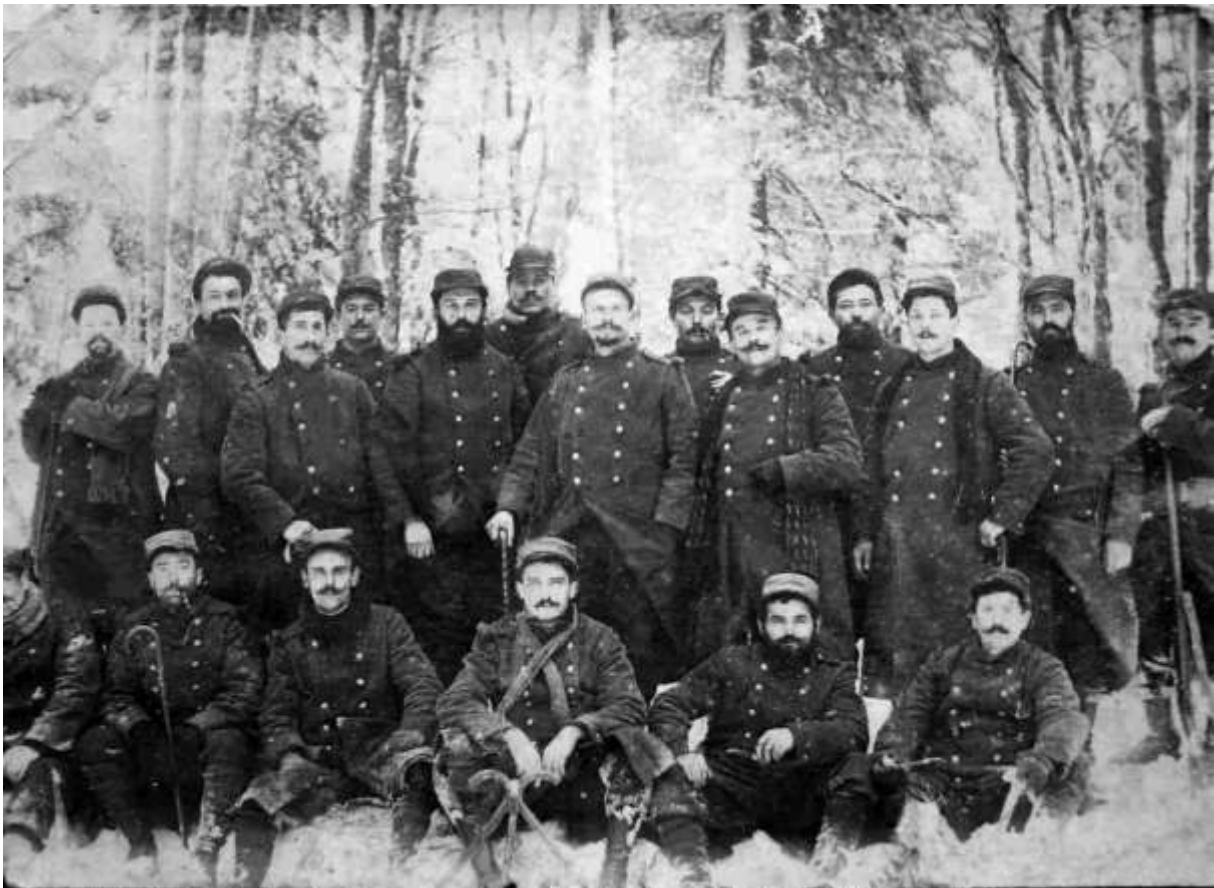
Hiver 1914, bien des souffrances ont été endurées par ces Poilus du 56 ème d'Infanterie. Bien d'autres sont encore à venir...

Loin d'être épargnée, la classe 1914, qui constitue l'essentiel des renforts parvenant au front ne va également pas être à l'abri des atrocités de guerre transformée depuis peu en une guerre de positions.