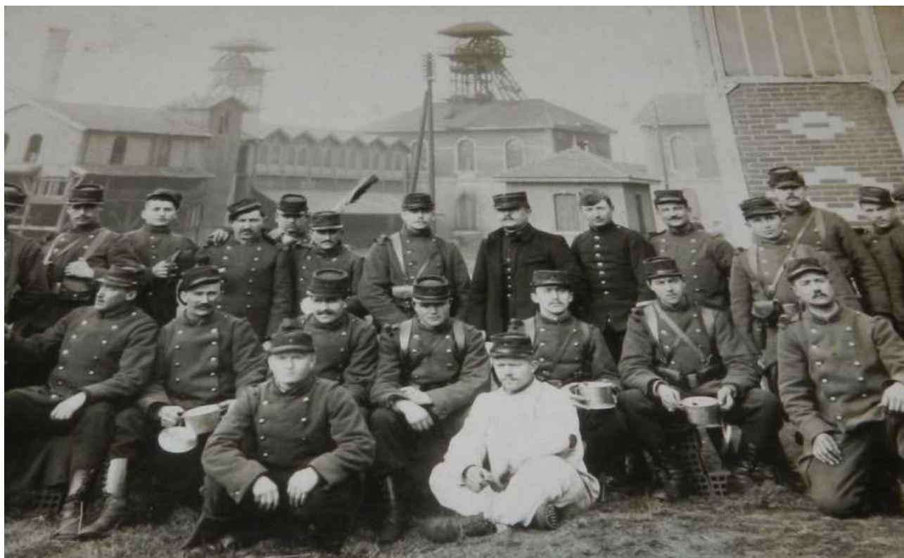
Photo souvenir pour ces Poilus stationnés dans une mine de charbon

Régiment de réserve nouvellement créé, le 256 ème d'Infanterie vient de prouver durant cette première année de guerre toute sa combativité ainsi que la bravoure des hommes qui servent dans ses rangs. Au prix de sacrifices humains conséquents, il rejoint dès lors la longue liste des régiments prestigieux de l'armée française.