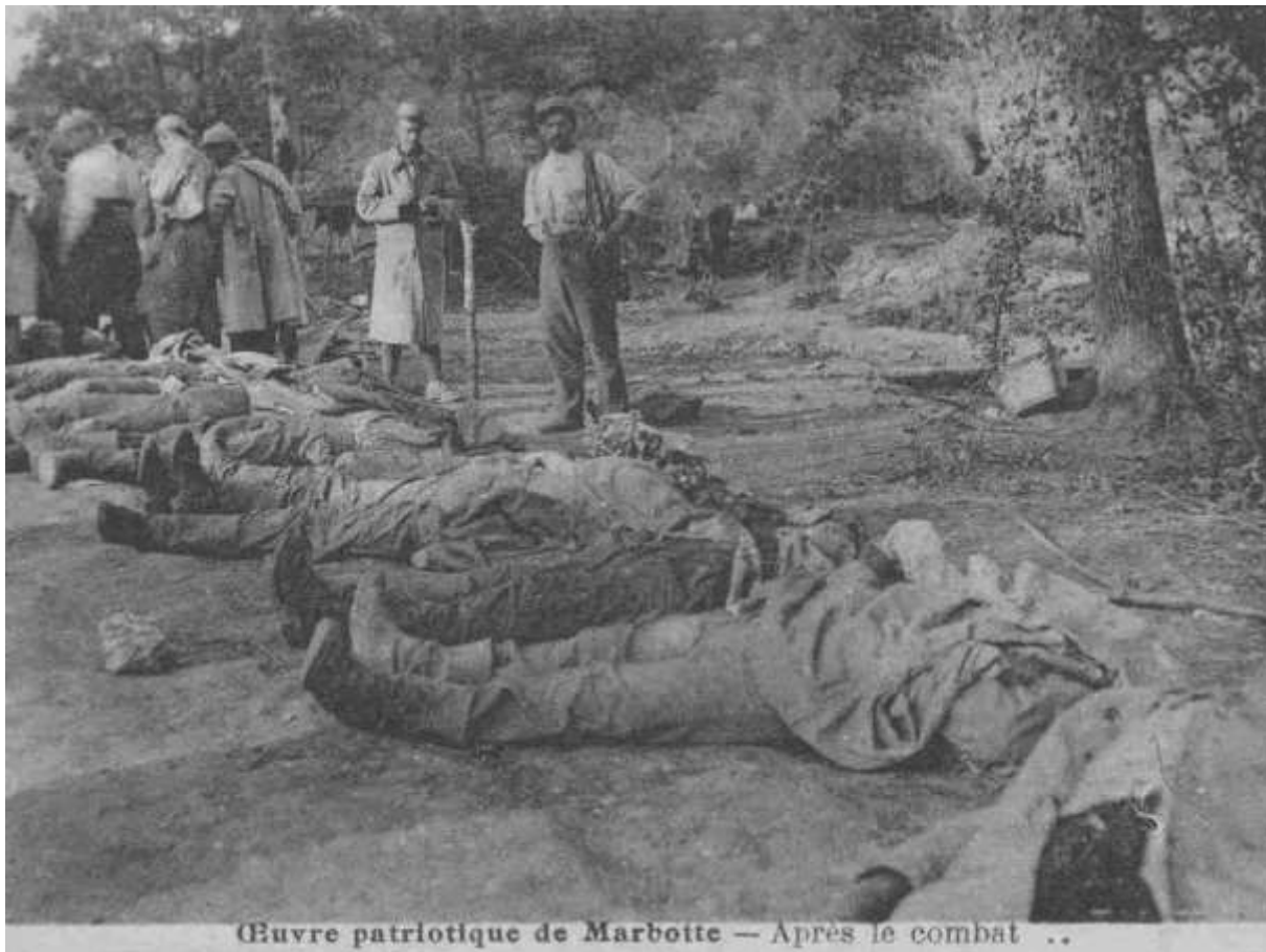
Œuvre patriotique de Marboite — Après le combat ..

736 hommes natifs de la Saône-et-Loire sont morts pour la France depuis les premiers combats d'août 1914.