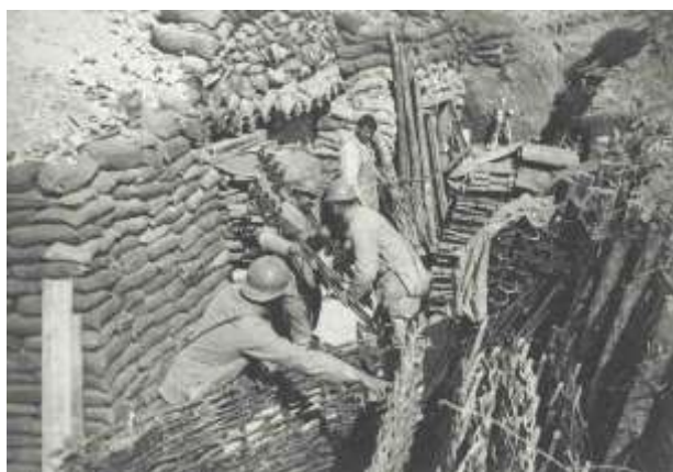
Travaux de renforcement des tranchées – secteur de Beauséjour

2 autres Poilus sont blessés le 4 février dans mêmes circonstances.