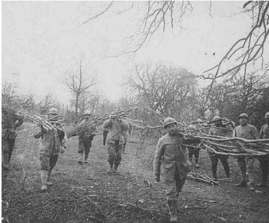
Transport de fascines servant au renforcement des tranchées (BDIC – fond Valois)

Le Sous Lieutenant Vallot passe de la 13 ème à la 22 ème Cie.