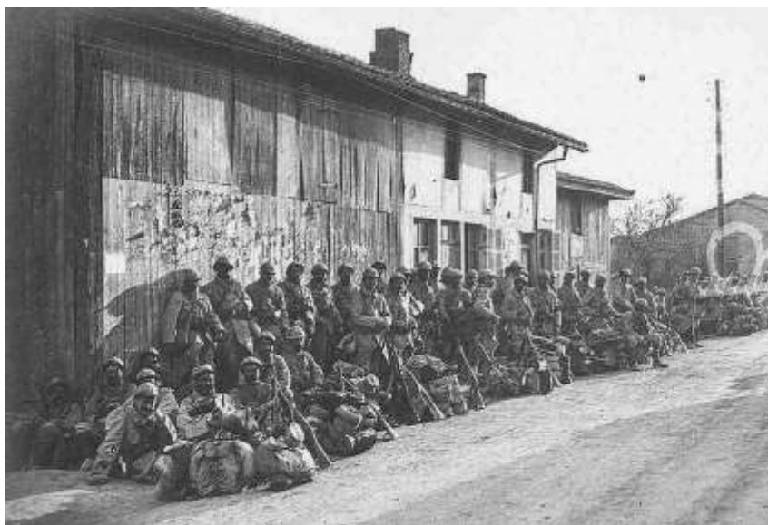
Une section en attente d'ordre à Somme-Bionne

Du 3 au 13 février, les unités s'installent dans les cantonnements. Commencement et poursuite des travaux des 2 ème et 1 ère positions.