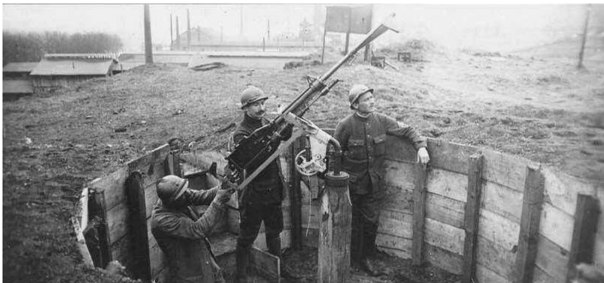
Mitrailleuse en position de défense contre les avions

Le 26 février, la 2 ème Cie cantonnée : 3 sections à Prémecy, 1 section à Ville-Dommange s'embarque le 26 Février à 7 heures en gare de Bouleuse pour être dirigée sur le Dépôt du 1ère Groupe d'Instruction à St-Cyr (Seine et Oise), à la disposition de la Défense contre avions. Elle arrive à Saint- Cyr le lendemain à 18 heures.