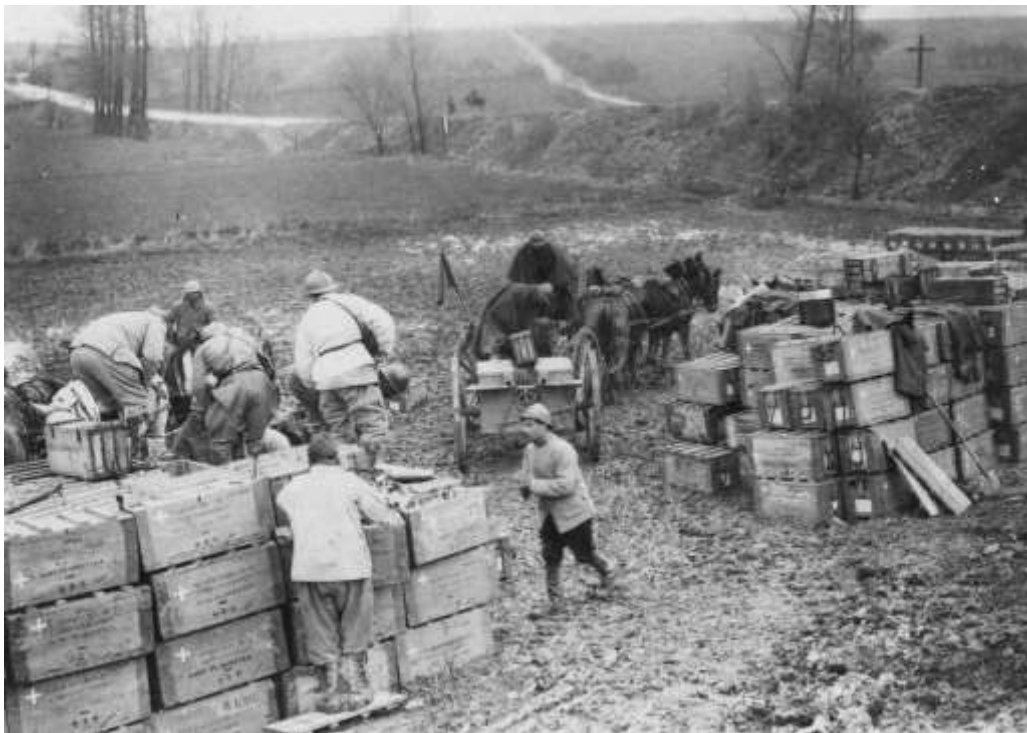
Corvée de ravitaillement en munitions

Le 12 février, le 1 er Bataillon relève le 2 ème Bataillon dans le quartier du Fortin tout en détachant 150 hommes qui sont mis à disposition du Colonel commandant l'Infanterie Divisionnaire de la 15 ème DI, afin d'assurer la main d'œuvre utile au ravitaillement en matériels et munitions au cours d'une opération qui doit s'effectuer dans le sous-secteur de La Courtine.