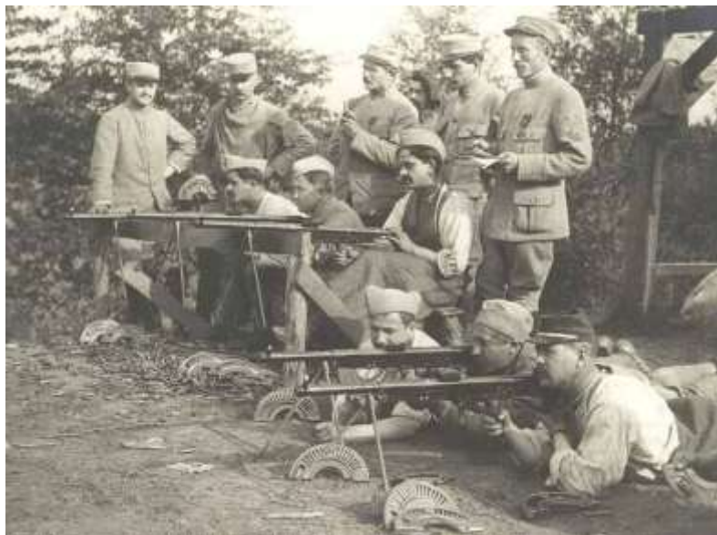
Entraînement au tir au fusil-mitrailleur Chauchat

Du 11 au 13 septembre, les entraînements reprennent avec force et vigueur. Au soir une instruction d'escrime à la baïonnette est également dispensée.