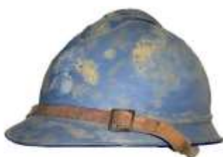
ASSOCIATION "POUR CEUX DE 14" Mémorial des Engagés de la Grande Guerre