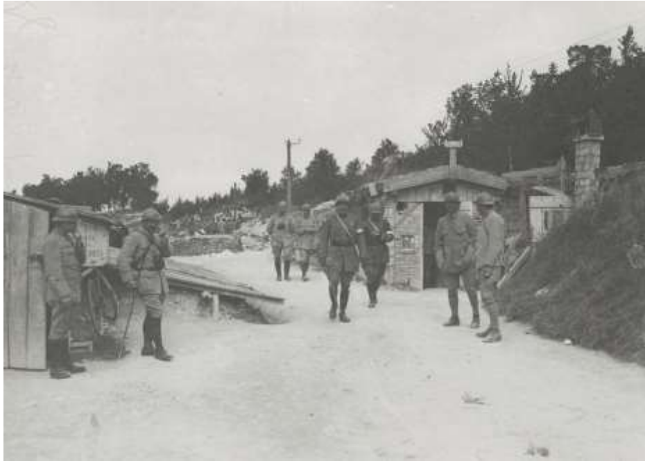
Abris à St-Léonard, à 4km de la 1 ère ligne