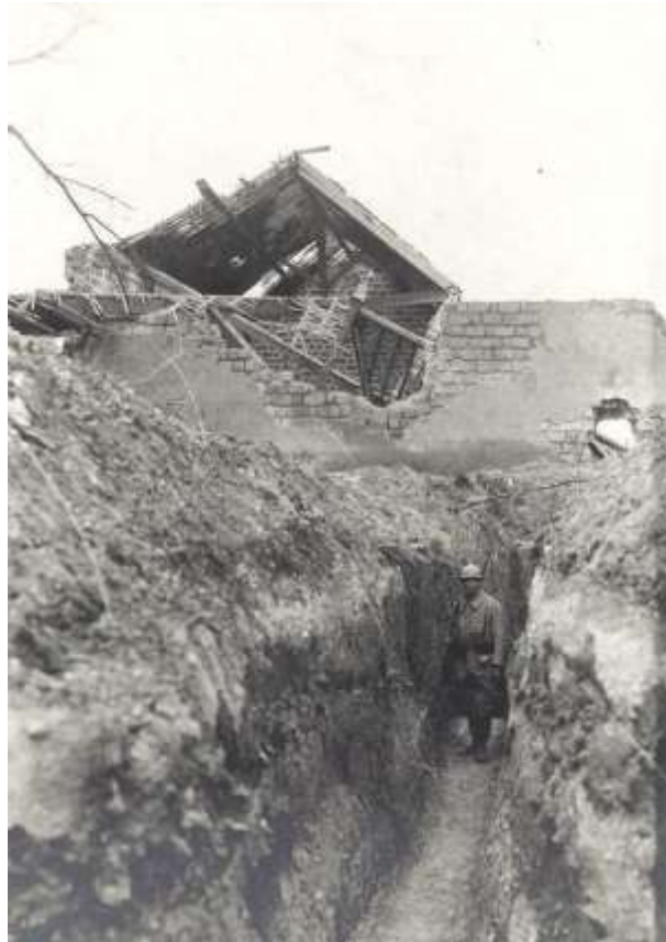
Ferme de La Jouissance