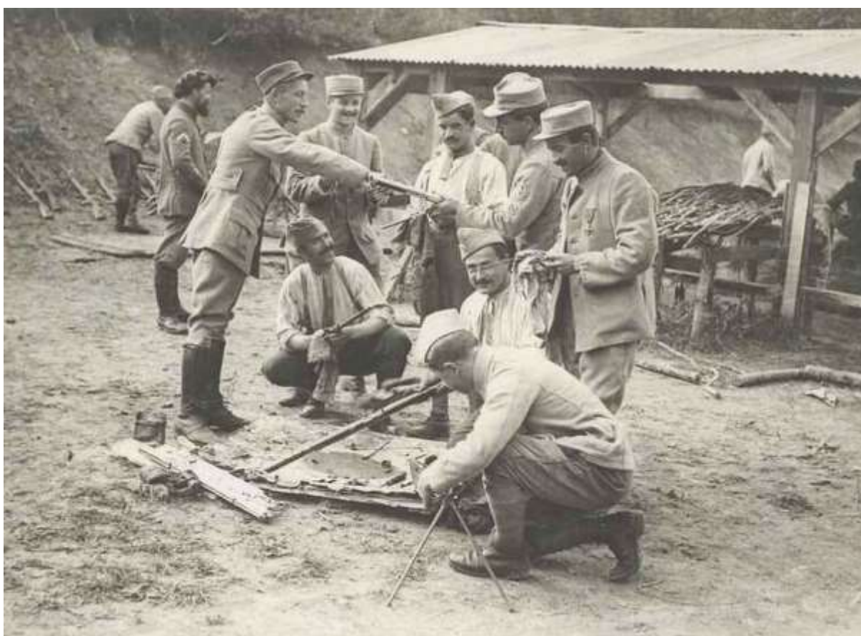
Instruction au démontage d'un fusil-mitrailleur Chauchat

Le Régiment poursuit ses activités d'entraînements divers.