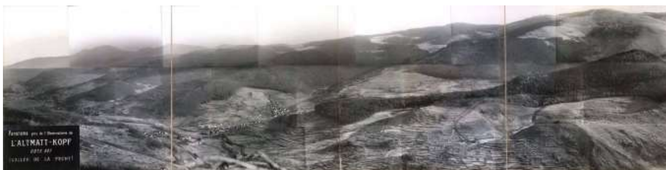
Canevas de tir pour l'artillerie – secteur de la Fecht